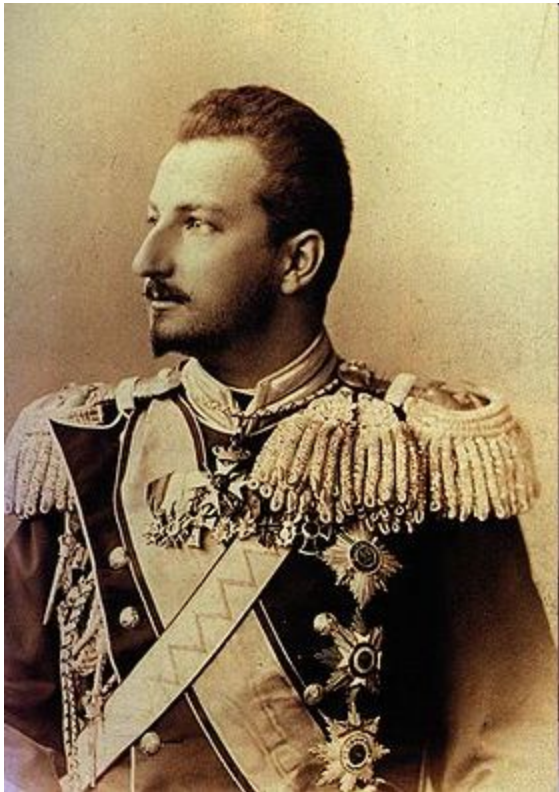
Фердинанд Саксен-Кобург. (1887 — 1908 — князь), а с 1908 по 1918 — царь Болгарии