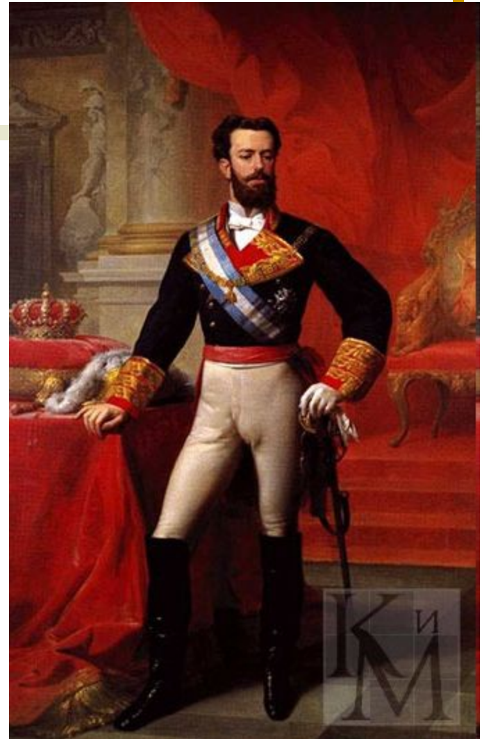
АМАДЕЙ САВОЙСКИЙ (1845-90), король Испании в 1870-73