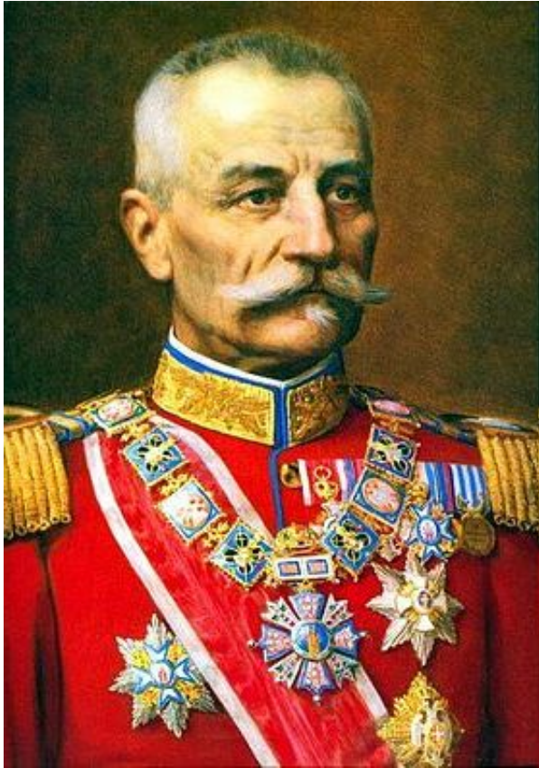
Петр Карагеоргиевич (1903-1921) король Сербии