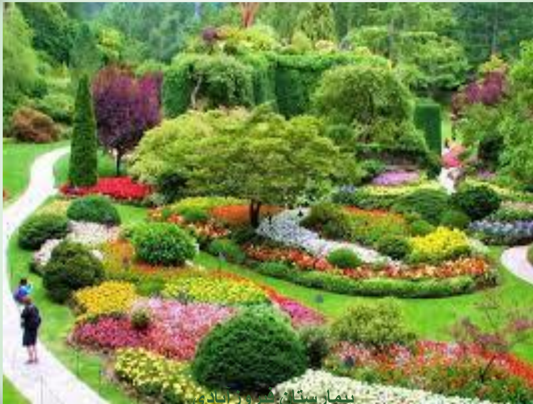
بیمارستان فیروز آبادی