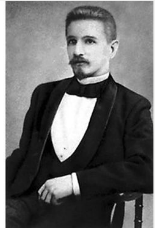
Борис Львович Розинг (1869-1933)