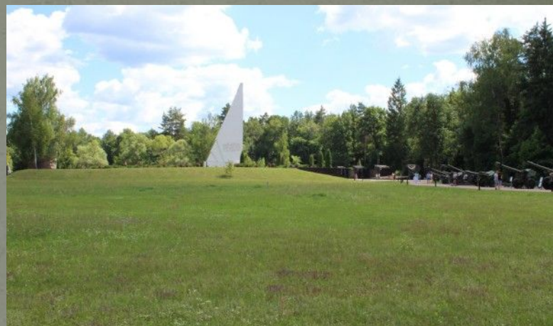
Брянск Партизанская поляна

В 1966 году на площади Партизан в Брянске открыт мемориал советским воинам и партизанам, в 1969 близ Белых Берегов — мемориальный комплекс «Партизанская поляна», в Клетне — памятник партизанам 1-й Клетнянской бригады (скульптор Г. П. Пензев, архитектор Ю. И. Тарабрин). В 1961 в Навле создан Музей партизанской Славы. В 1960-70-х годах в брянских лесах на месте партизанских лагерей и баз создано 8 историко-мемориальных заповедников. В 1983 году город Дятьково награждён орденом Отечественной войны 1-й степени.