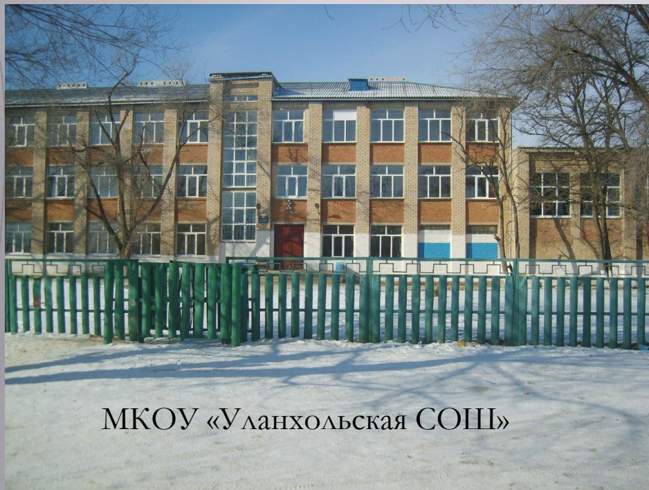
МКОУ «Уланхольская СОШ»

В УЛАНХОЛЬСКОМ СМО ИМЕЮТСЯ СРЕДНЯЯ ШКОЛА, ДЕТСКИЙ САД, ВРАЧЕБНЫЙ ОФИС, ДОМ КУЛЬТУРЫ, СЕЛЬСКАЯ БИБЛИОТЕКА