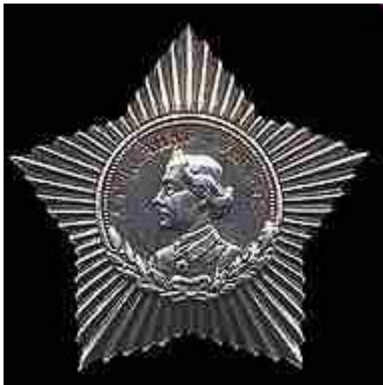
Орден Суворова III степени