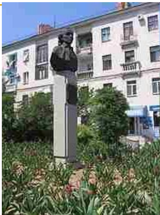
Памятник А. В. Суворову в Севастополе, 1983