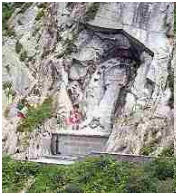
Памятник Суворову в швейцарских Альпах