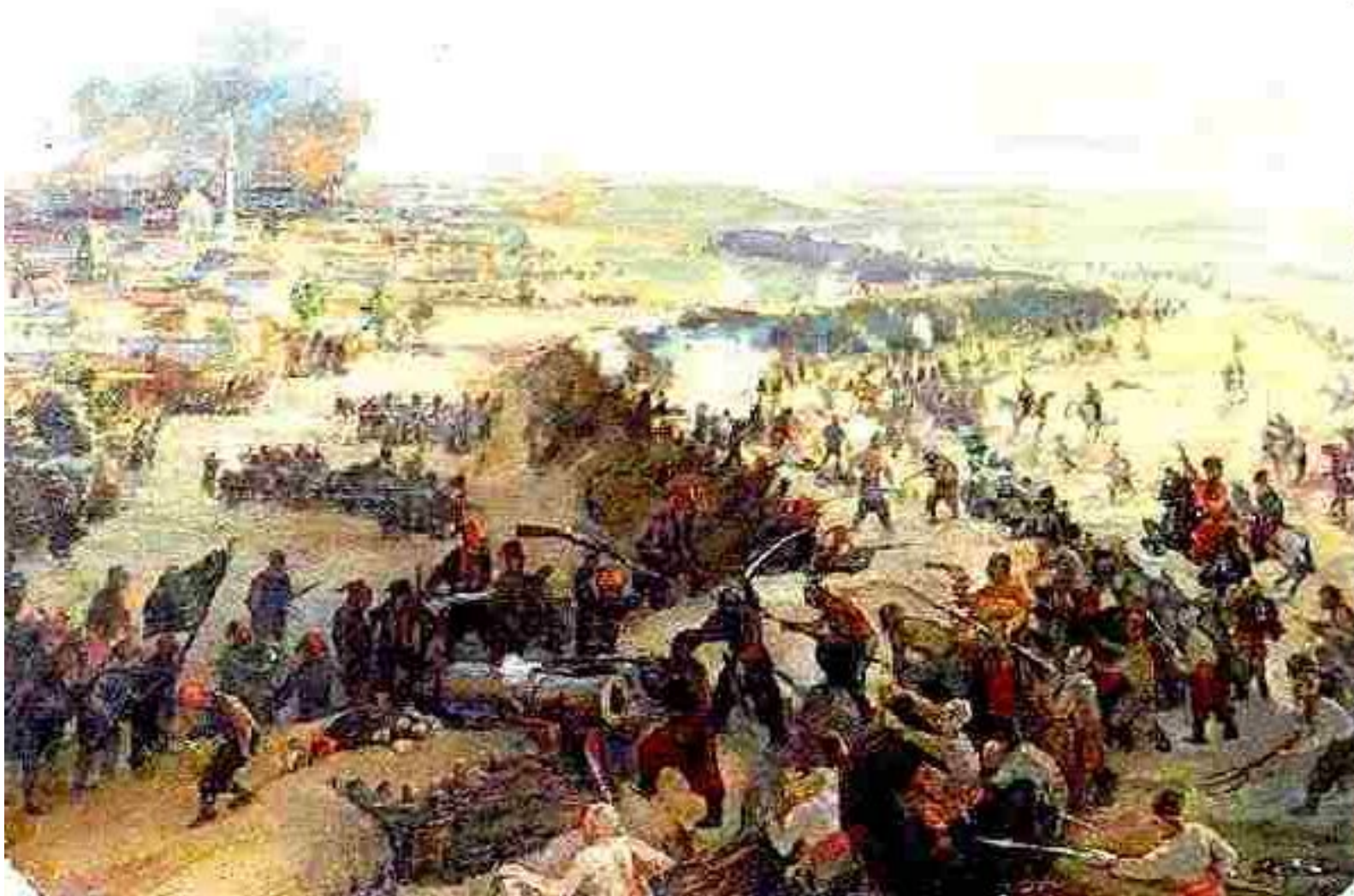
Русско-турецкая война 1787—1791