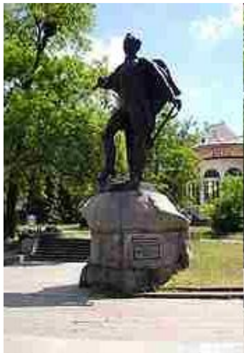
Памятник Суворову на месте редута на берегу Салгира