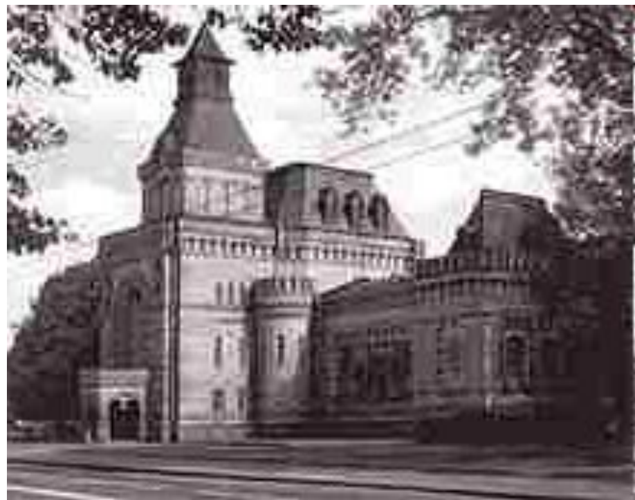
Мемориальный музей Суворова в Санкт-Петербурге