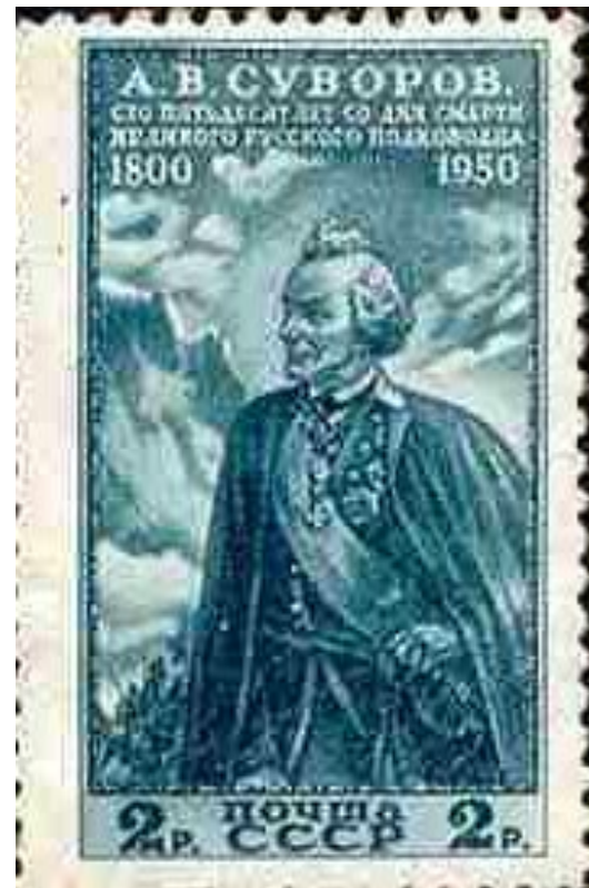
Марка «Суворов в Альпах» (с рисунка Николая Аввакумова, 1941, Москва, Государственный музей изобразительных искусств имени А. С. Пушкина)