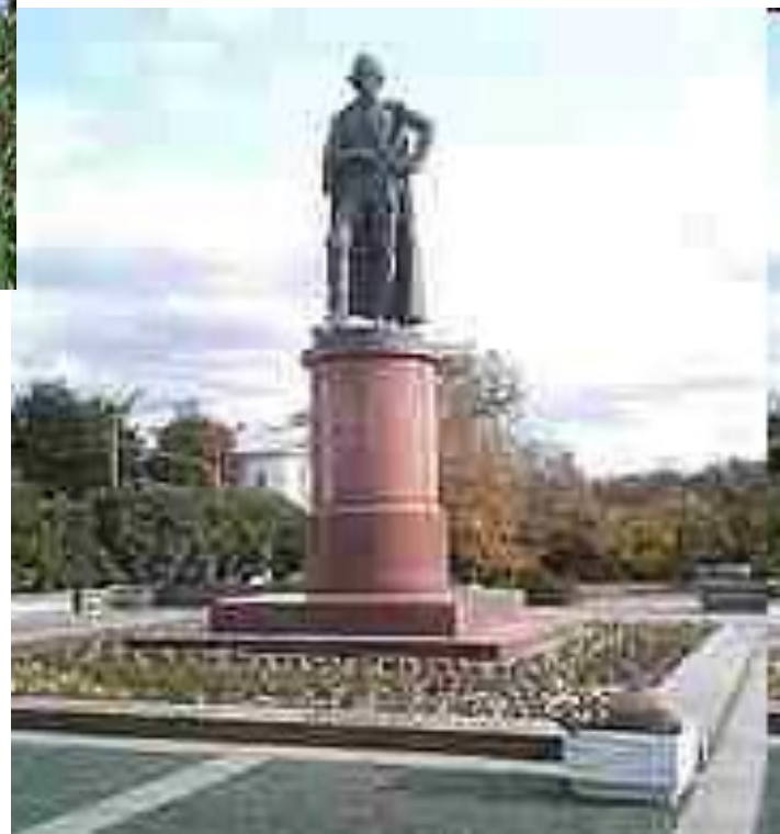
Памятник Суворову в Москве. Скульптор О. К. Комов