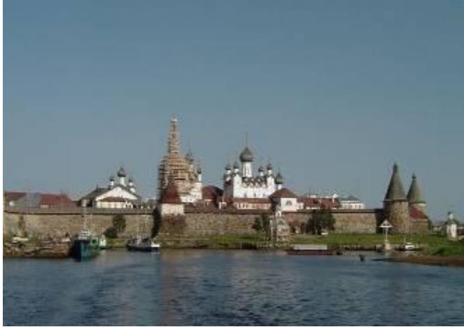
Крепость на Соловках (1579г.)