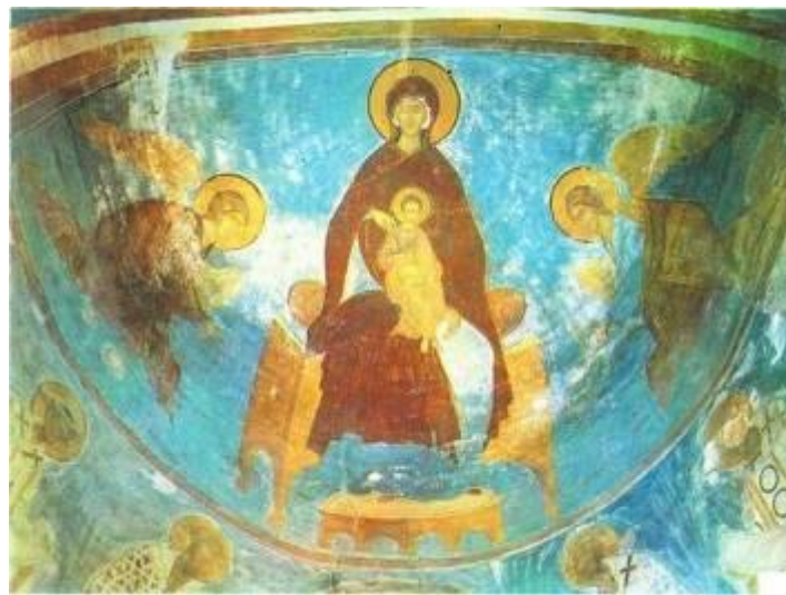
Богоматерь с архангелами Михаилом и Гавриилом