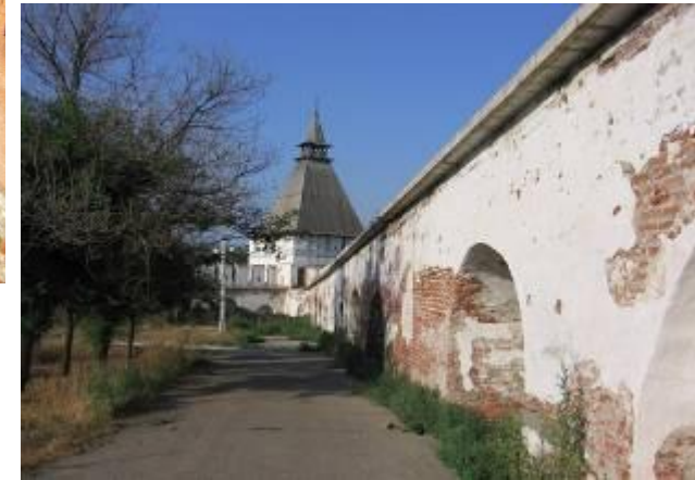
Астраханская крепость (1582-89 гг.)