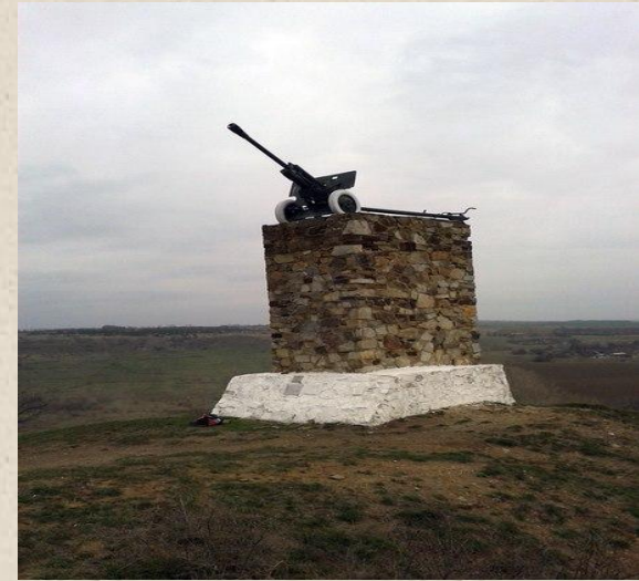
Памятник-пушка в честь бойцов и командиров 248 СД, взявших штурмом опорный пункт противника на высоте «Черный ворон». 19.08.1943г.

а по улице наши "Т-34" душили как цепь гонимых в пасти негнущих немцев. В артиллерии, 48 автомашин, 9 минометов, больше запасов патронов и 120 снарядов были нашими трофеями. Н. обеду всё отряд наш празднует победу уже в лагере. 17. Июля. Так же своим лагерем ночью тихо приходим в район высоты «Черный Ворон», целую ночь наши «старшины артиллерии» бомбили, и пошлём артиллерией немцев оборону. 18. Июля. Утром при сильном дуновении утрачена часть снарядов, было разбито несколько снарядов стоящих почти одна около вт. ур. в дождь не далеко от нас пошла Гвардейские минометы. В 10.00 в 6.00 м взорвало земля от мощной артиллерийской залпа снарядов, на высоту обрушился своем мост, на высоту сбросили наступила вторая ночь хотя она уже прошла, все снаряды с дымом и пылью, на немецкой стороне нечего слышно было ведёт все окутано дымом так продолжалась затишье.