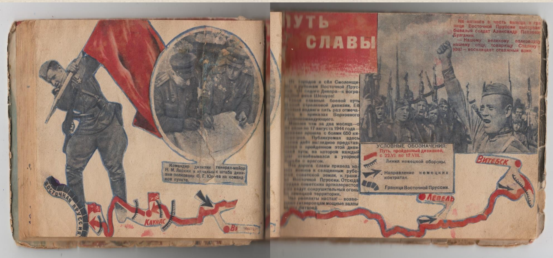
Страницы дневника, где указан путь от Смоленска до Восточной Пруссии 63 стрелковой дивизии 5 армии 3 Белорусского фронта.