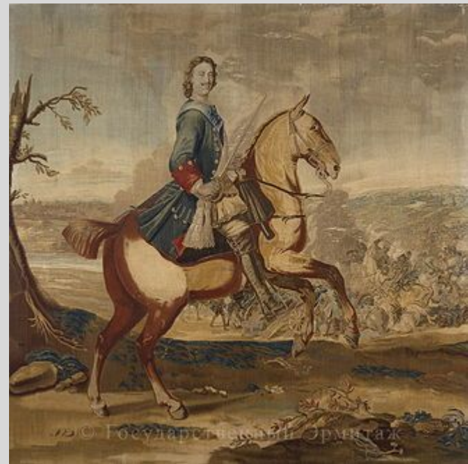
Шпалера «Полтавская баталия». Петербургская шпалерная мануфактура

30 января 1755 года по указу императрицы Елизаветы Петровны Петербургская шпалерная мануфактура была передана в ведение Сената