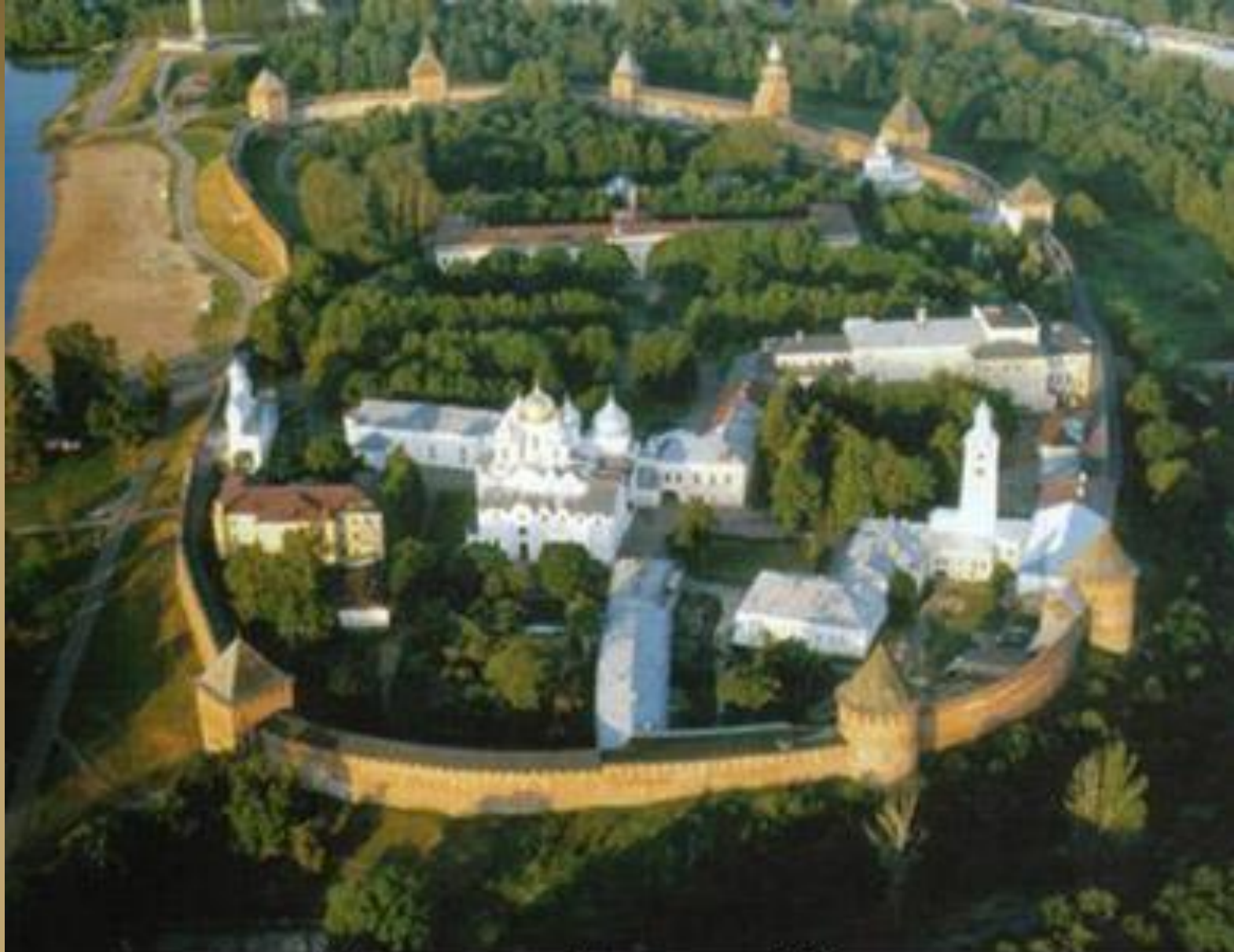
Новгородский кремль. XV в.