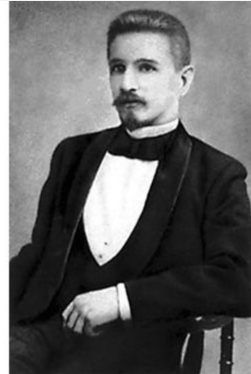
Борис Львович Розинг (1869-1933)