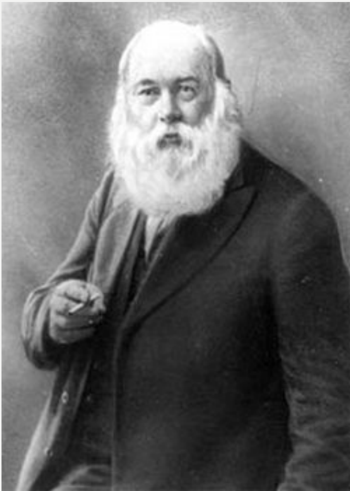
Порфирий Иванович Бахметьев (1860—1913)