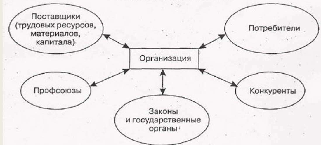
Среда прямого воздействия