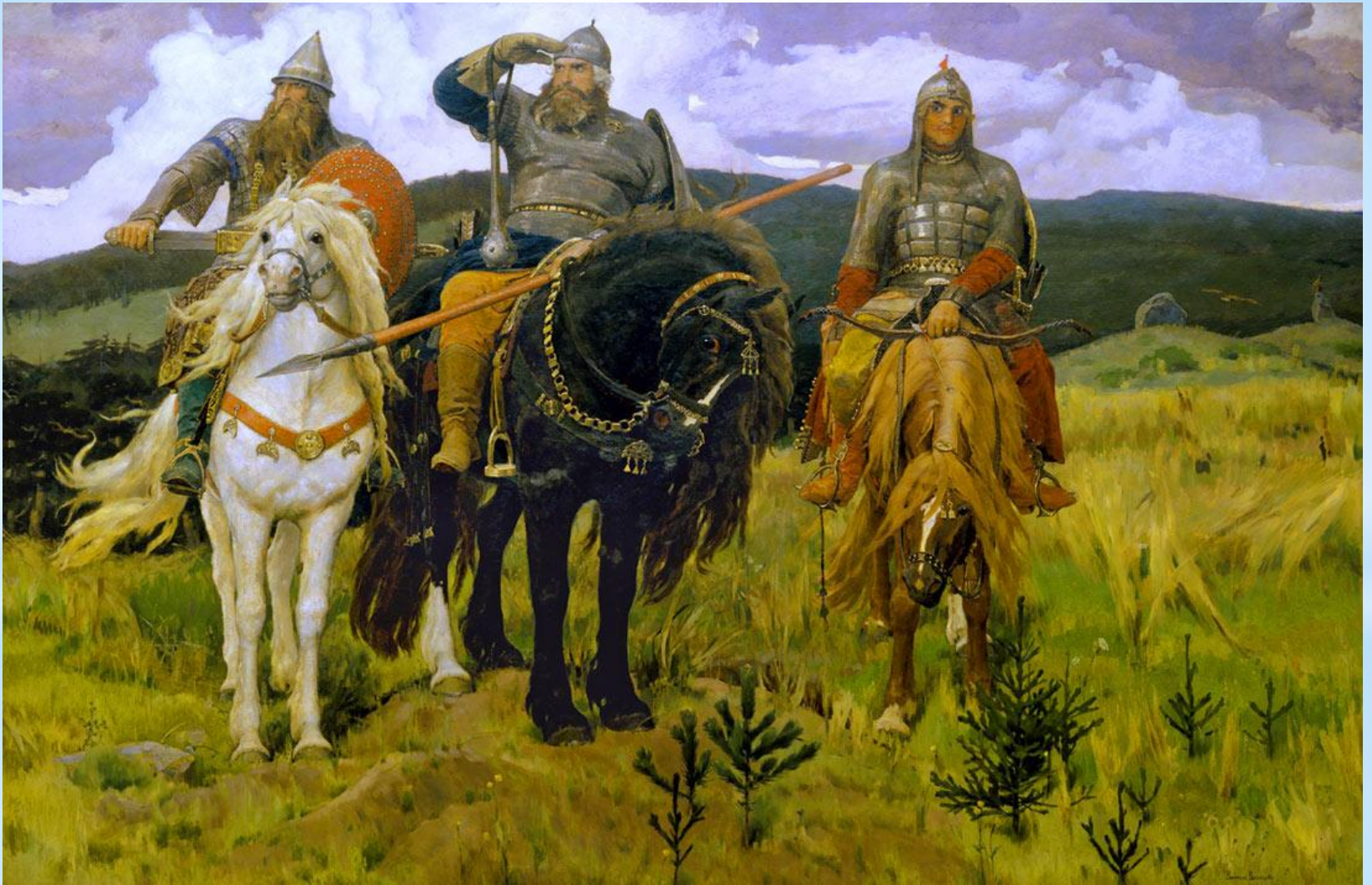
* Васнецов «Богатыри»