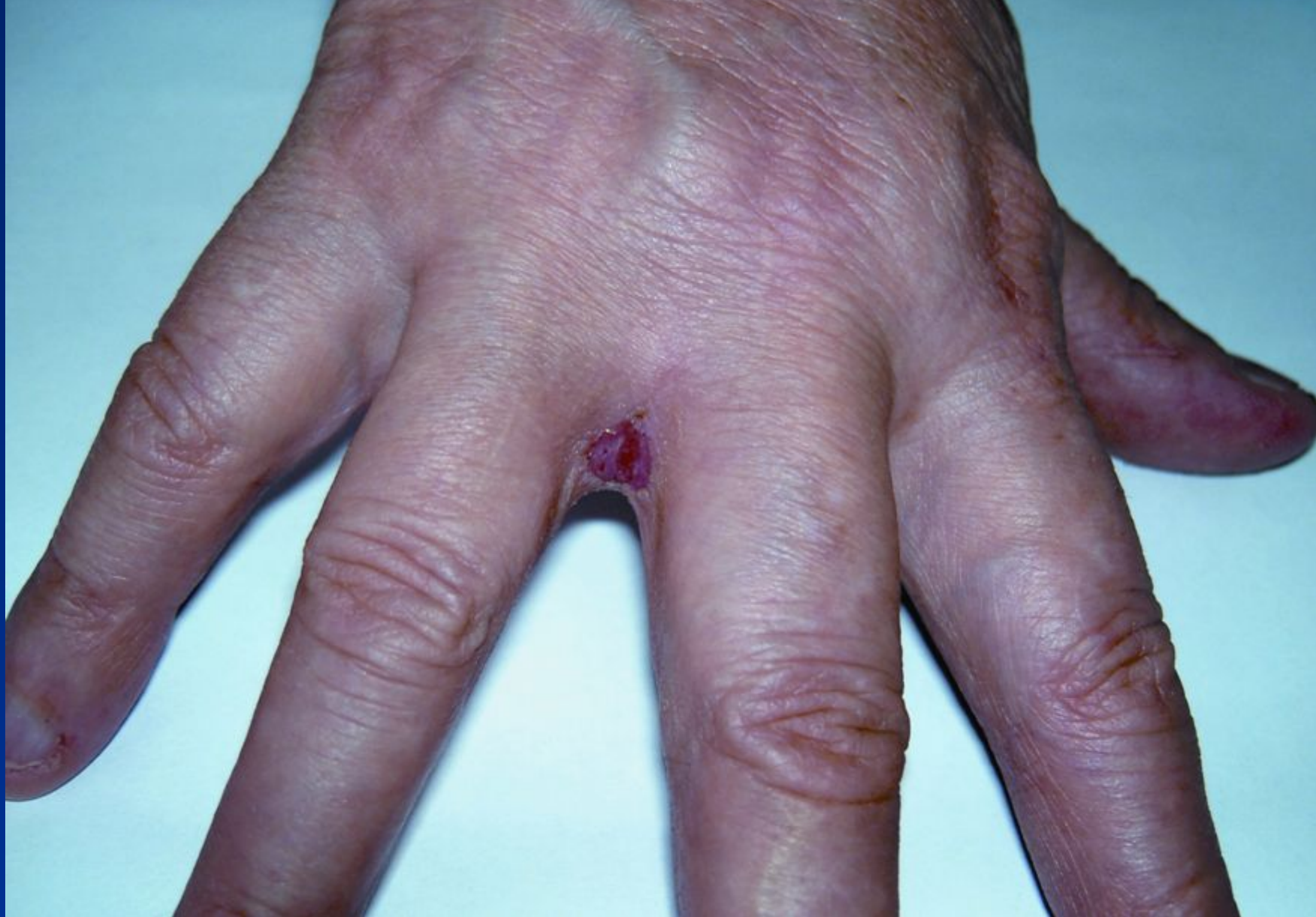
Кандидозна міжпальцева ерозія