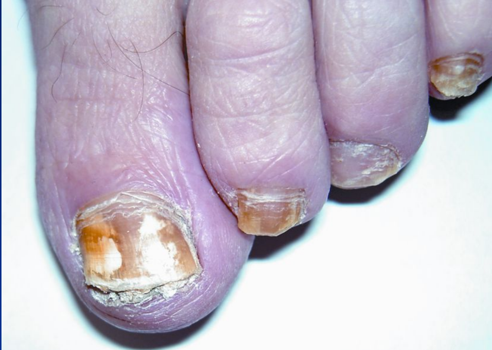
Дерматофітія нігтів (оніхомікоз), гіпертрофічна форма