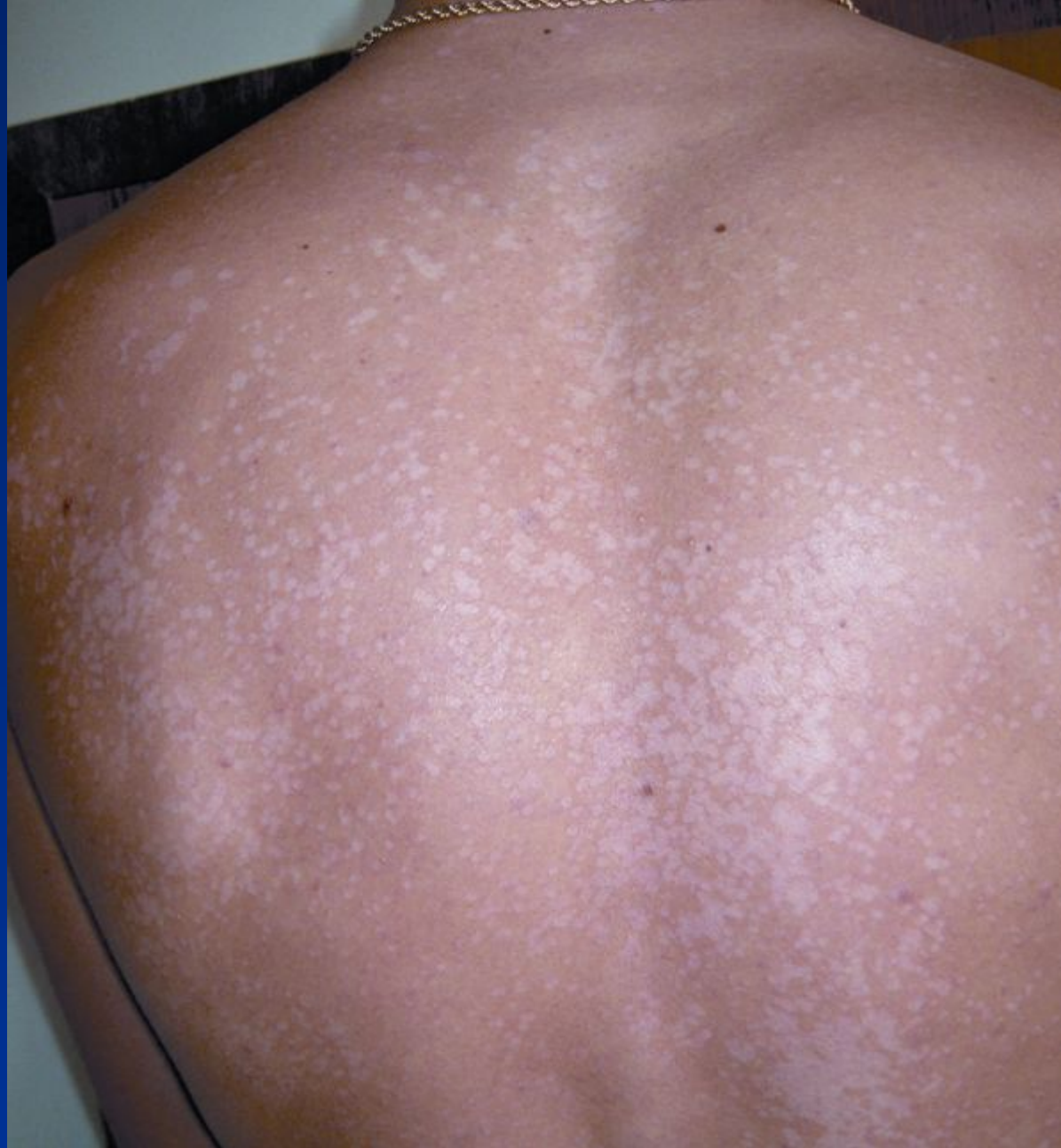
Різнокольоровий пітиріаз, псевдолейкодерма