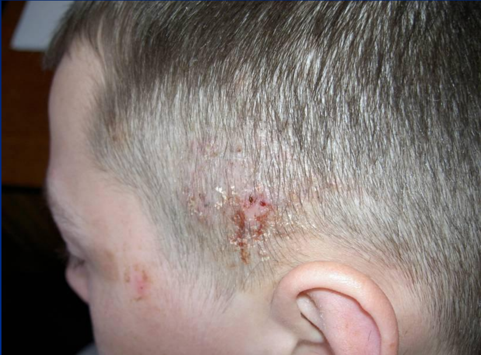
Поверхнева трихофітія волосистої частини голови