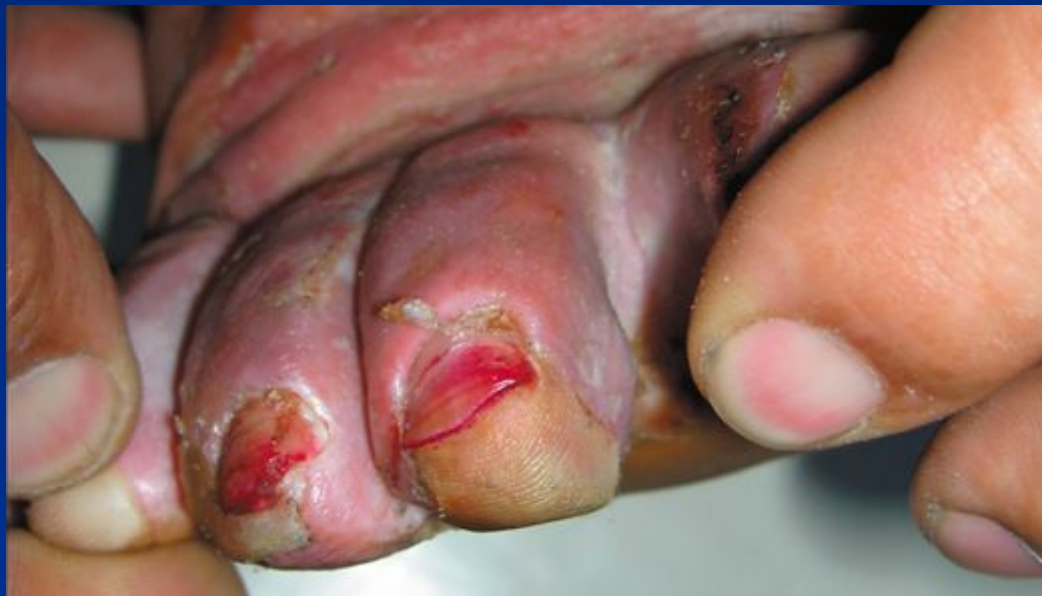
Дерматофітія стоп, інтертригінозна форма