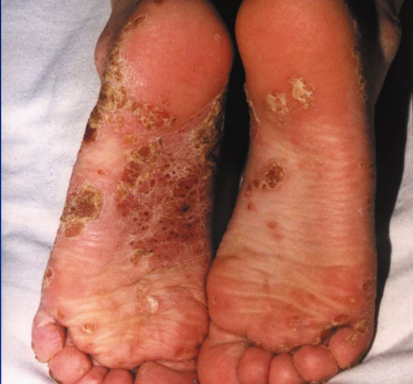
Дерматофітія стоп, дисгідротична форма