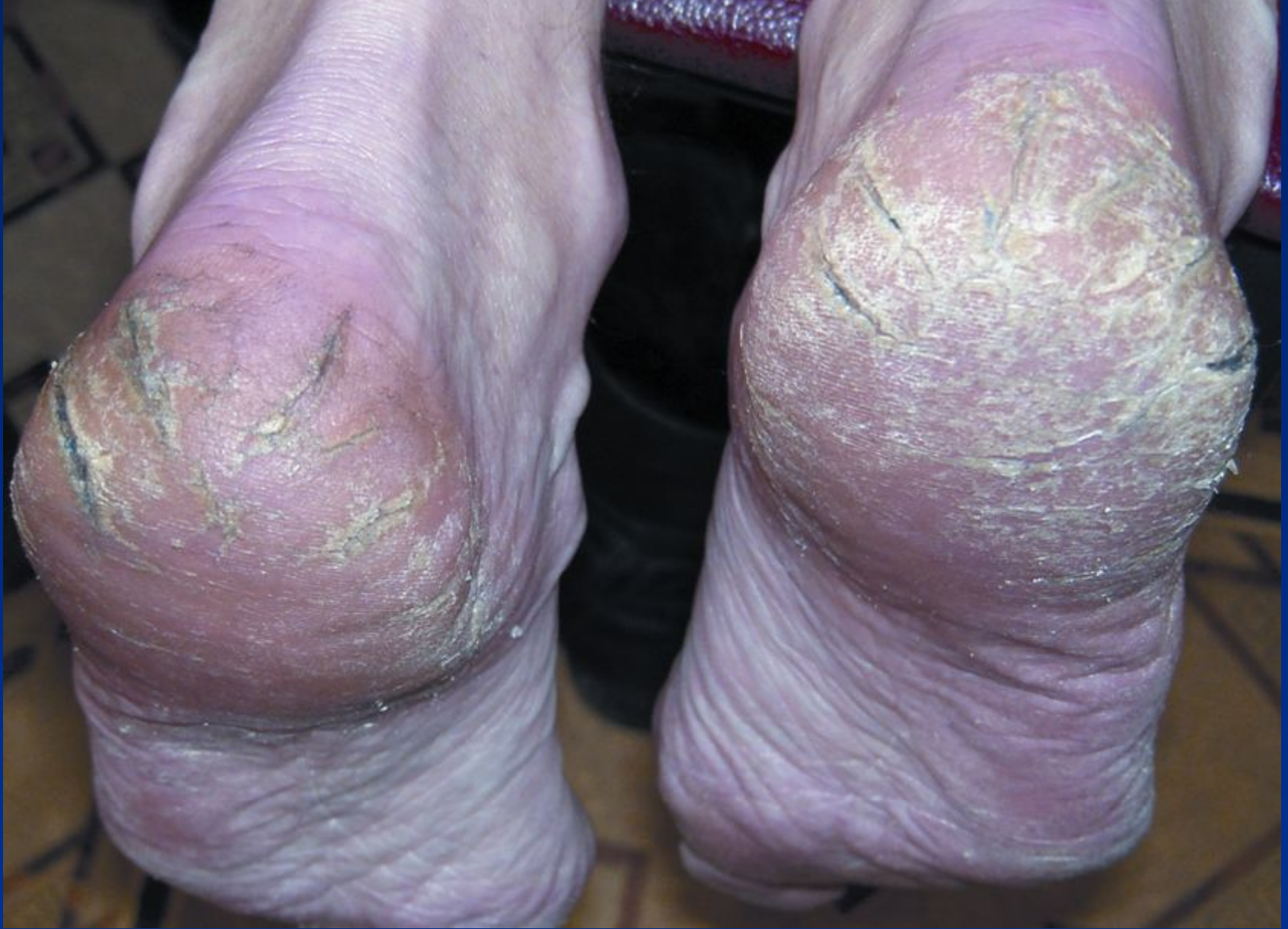
Дерматофітія стоп, сквамозно-гіперкератотична форма