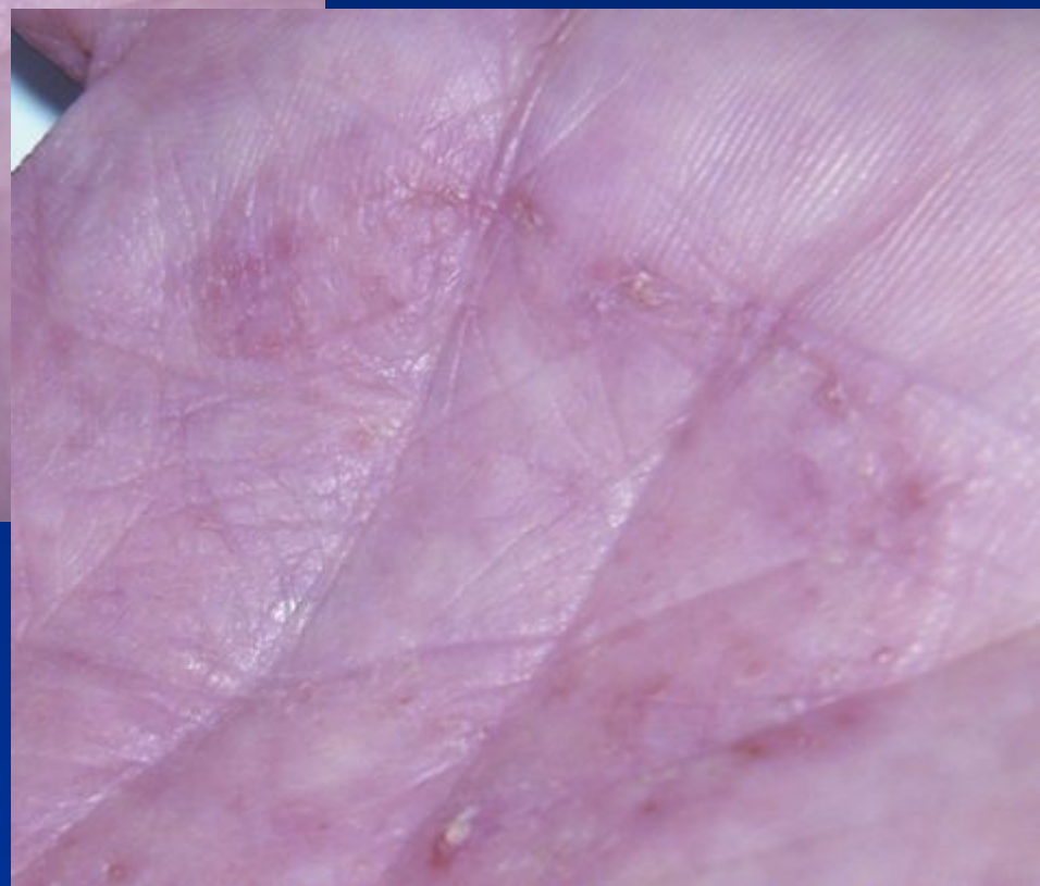
Руброфітія долонь, типовий варіант