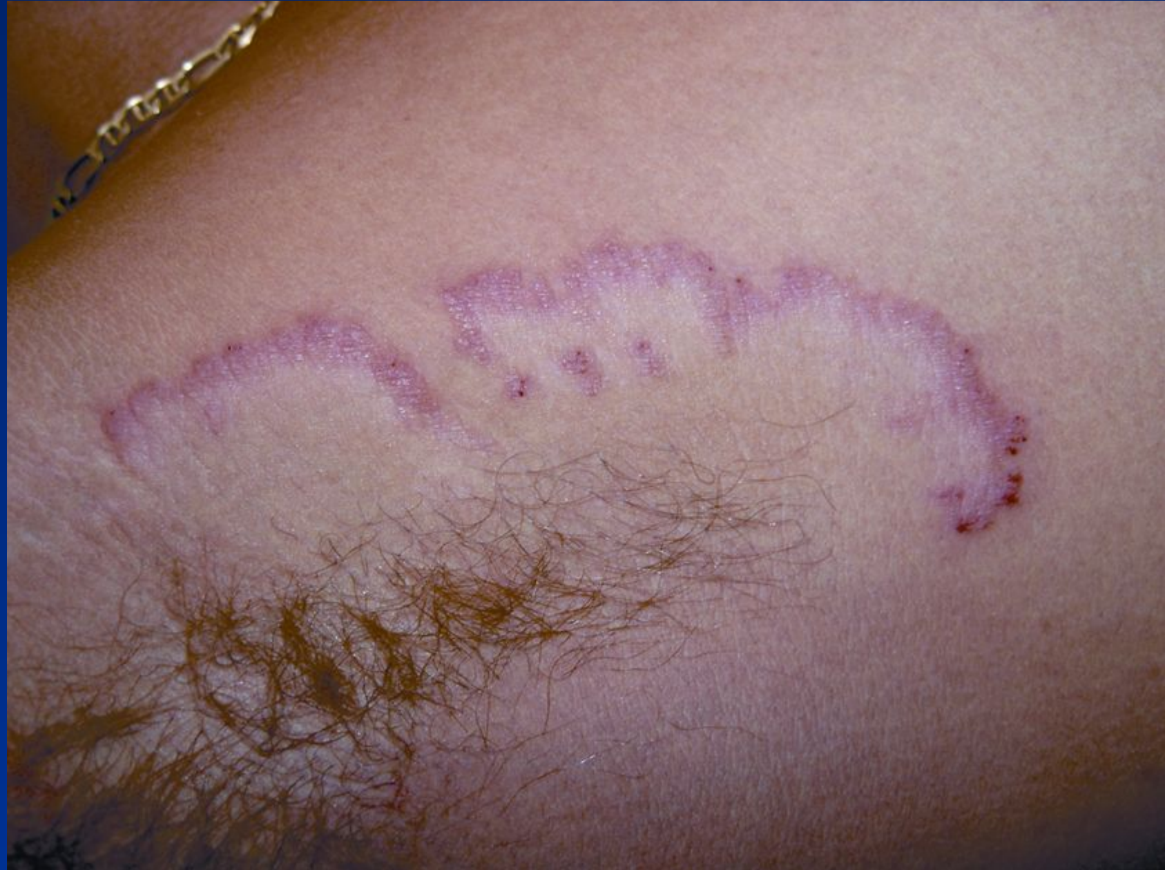
Дерматофітія пахова 8