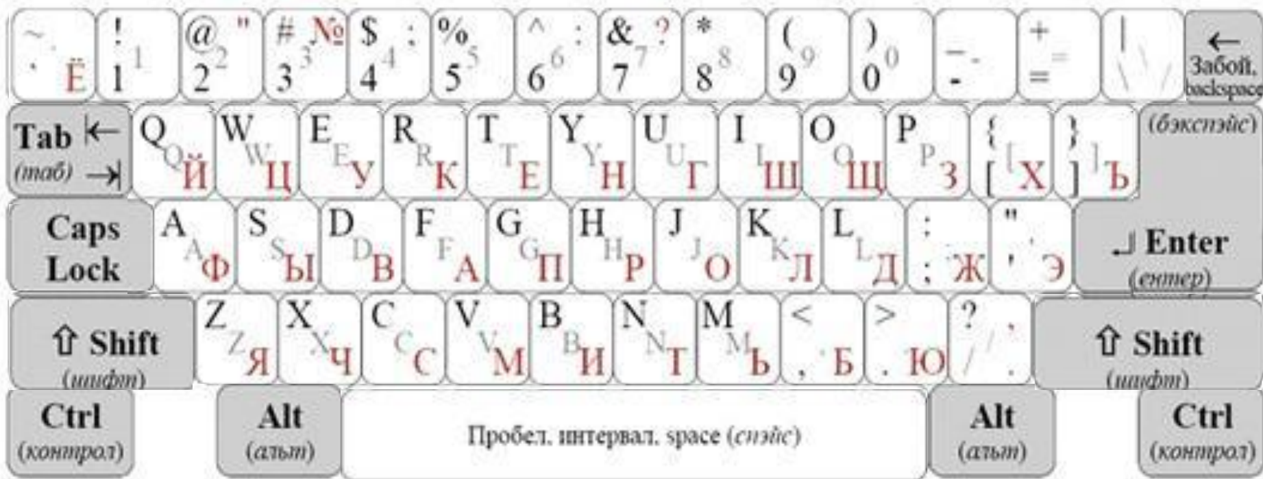
Рис. 1. Образец алфавитно-шифровой клавиатуры

Повторим назначение основных клавиш клавиатуры