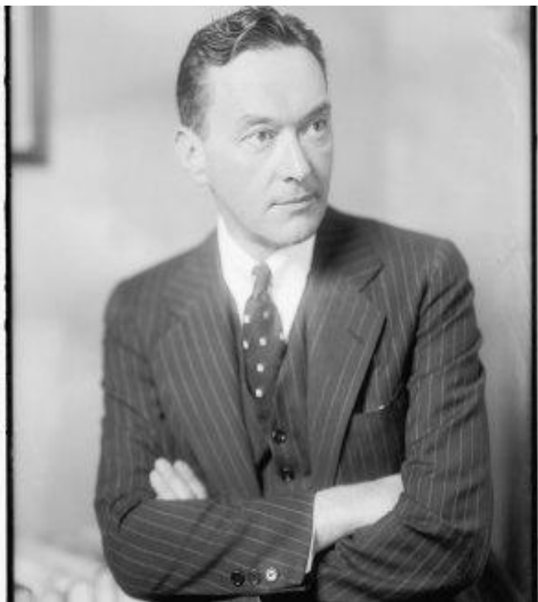
У. Липпман ( 1889 – 1974)

Впервые термин «социальный стереотип» использовал американский журналист У. Липпман в 1922 г. в книге «Общественное мнение»