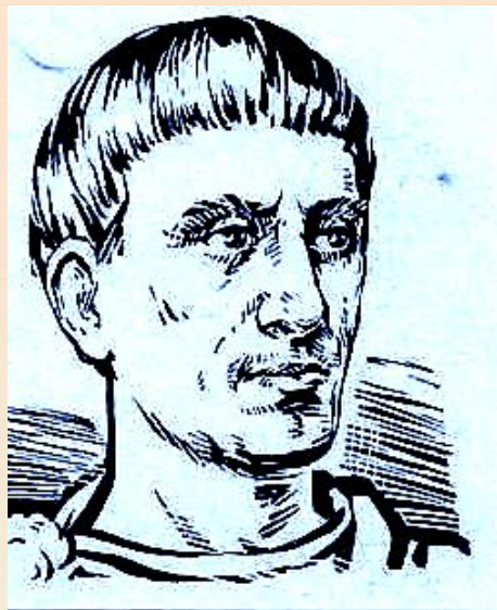
Диофант Александрийский (III век н. э.) — древнегреческий математик.

Еще в глубокой древности было замечено, что некоторые многочлены можно умножать быстрее, чем все остальные. Так, древнегреческими математиками еще до нашей эры (более 2000 лет назад) геометрическим способом были выведены некоторые формулы, которые получили название формулы сокращенного умножения.