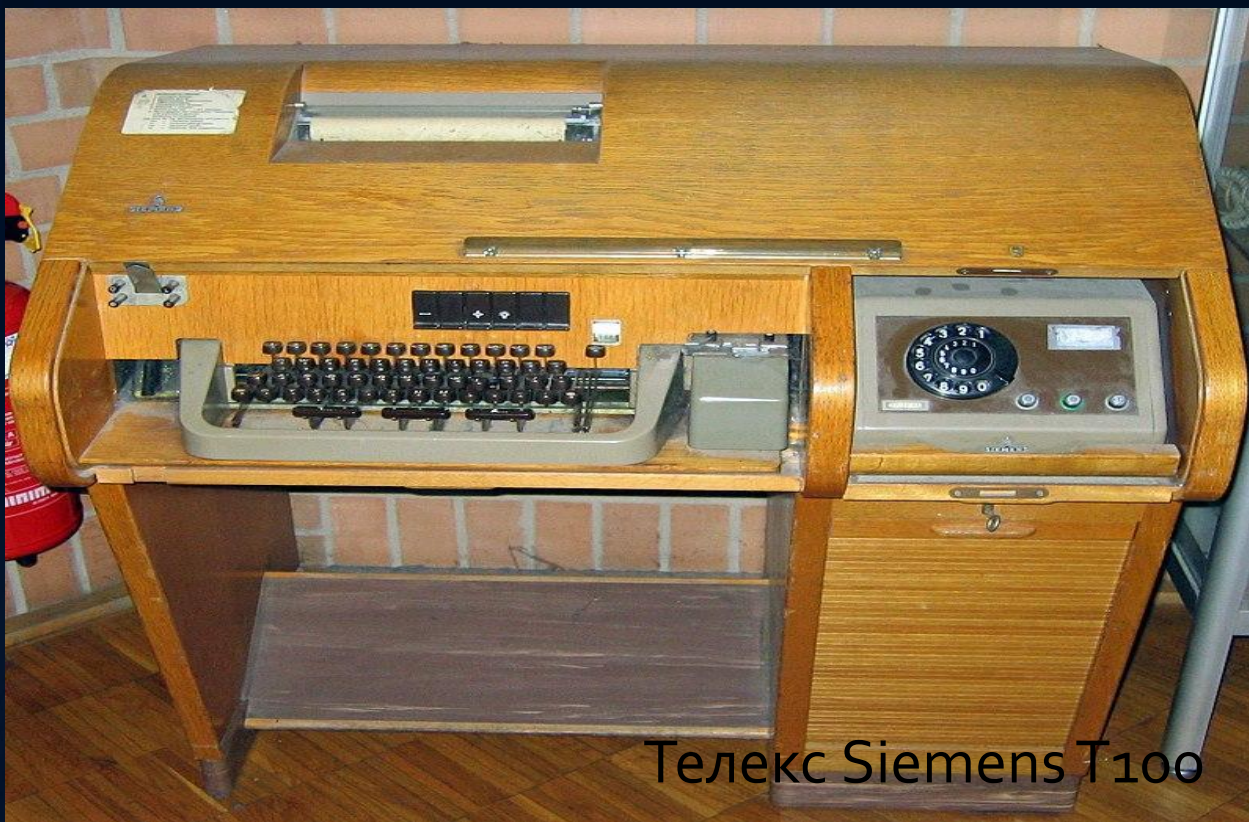
Телекс Siemens T100

Телеграф (от греч. τῆλε — «далеко» и γράφω — «пишу») в современном значении — средство передачи сигнала по проводам, радио или другим каналам электросвязи.