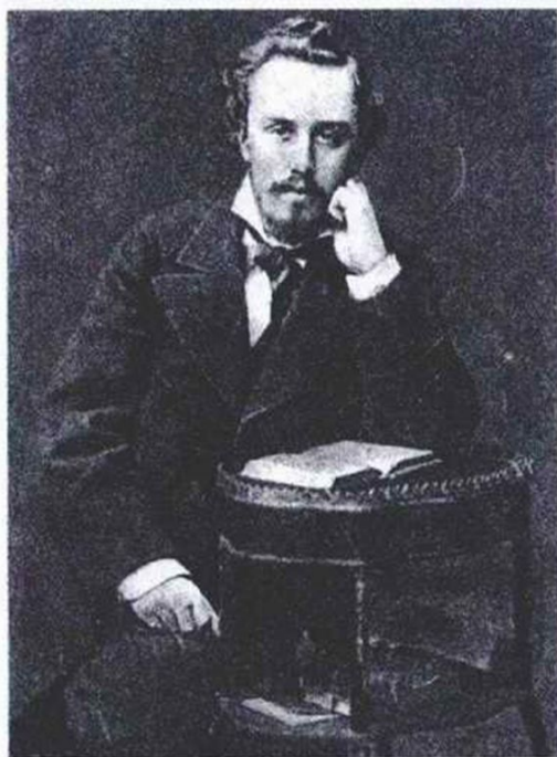
А.Л. Блок (отец поэта).