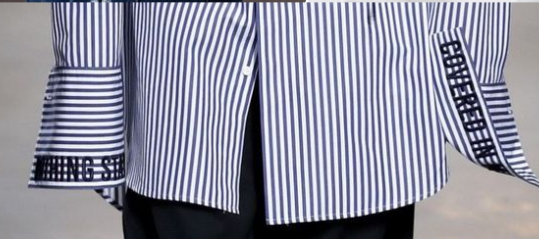
Нашивка с печатью