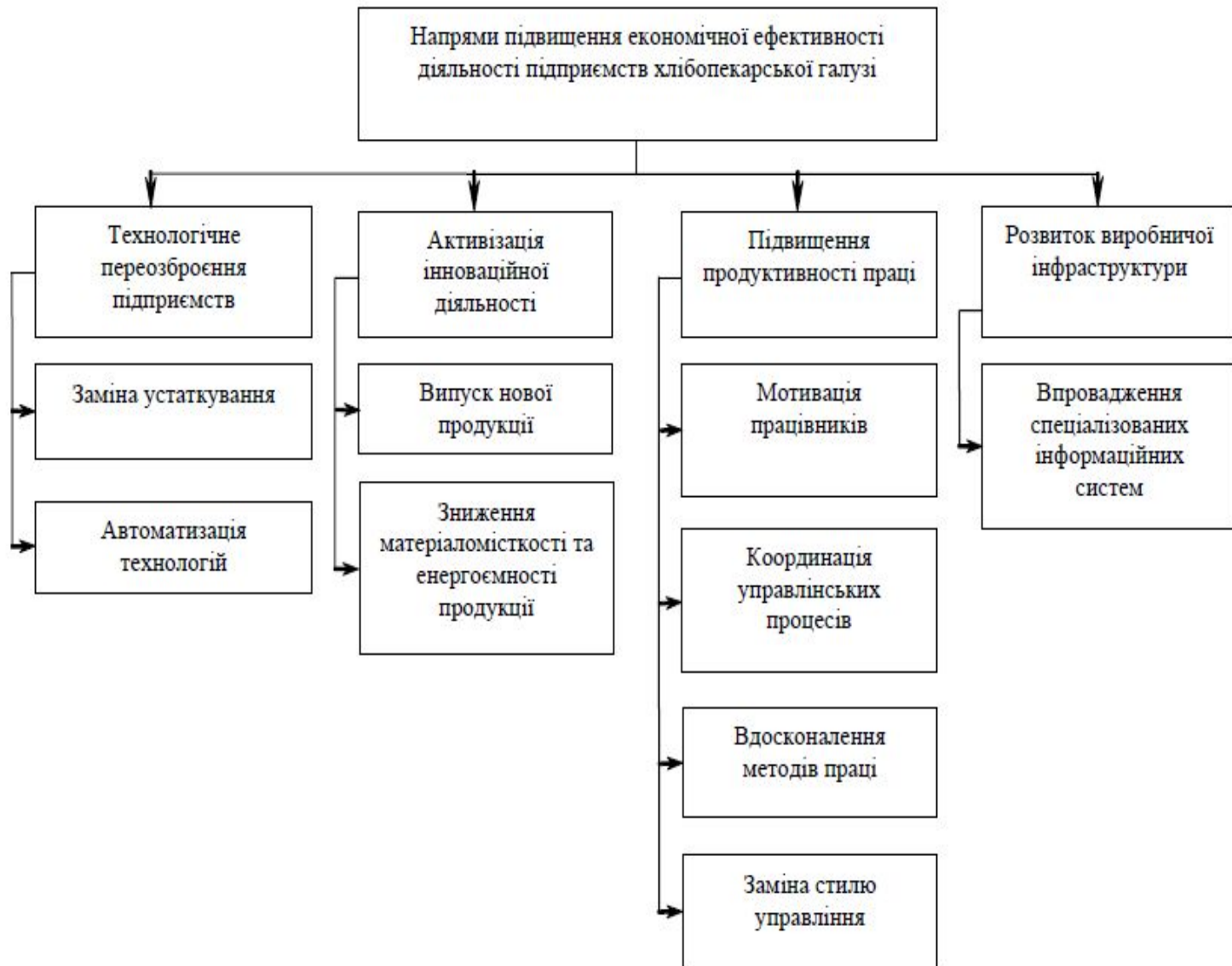
Рис. 2. Напрями підвищення економічної ефективності підприємств