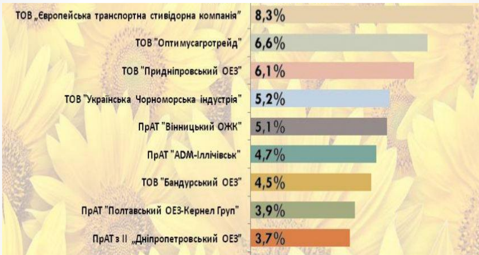
Рис. 3. Найбільші виробники олії соняшникової нерафінованої у 2020-2021 маркетинговому році