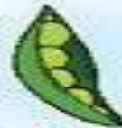
les petits pois