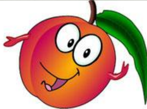
un abricot (apricot)