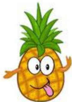
un ananas (pineapple)