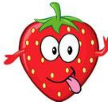
une fraise (strawberry)