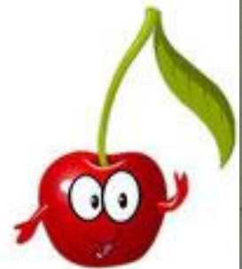
une cerise (cherry)