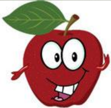
une pomme (apple)