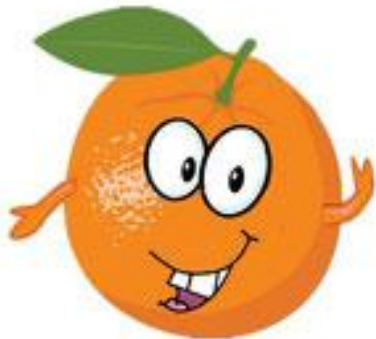
une orange (orange)