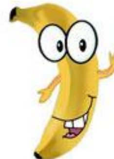
une banane (banana)