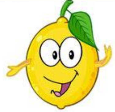
un citron (lemon)