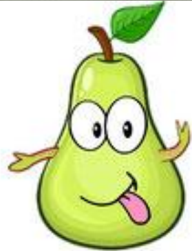
une poire (pear)