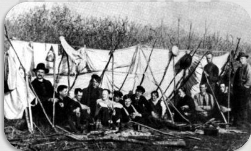
В К. Арсеньев со студентами