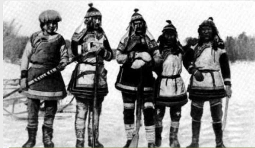
В К. Арсеньев (в середине) с удэгейцами в национальных костюмах

Июнь 1917г. - февраль 1918г. - экспедиция в бассейн среднего течения Амура для обследования бассейна реки Тунгуски.