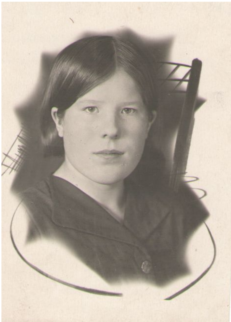
1 февраля 1942г. Сыктывкарское педучилище – 1 курс.

В 14 лет окончила 7 класс и уехала в Сыктывкар учиться в педучилище на учителя начальных классов. Давали стипендию 36 рублей в месяц. Норма для питания была 400 грамм хлеба, 200 грамм сахара в месяц. Кормили в столовой супом из картофеля и капусты. Каша из муки или манка жидкая, как кисель, чай на свои деньги. Иногда продавали булки, плюшки. Купим, сами не едим, а сразу сдаем на сухари для фронта. Жили в общежитии.