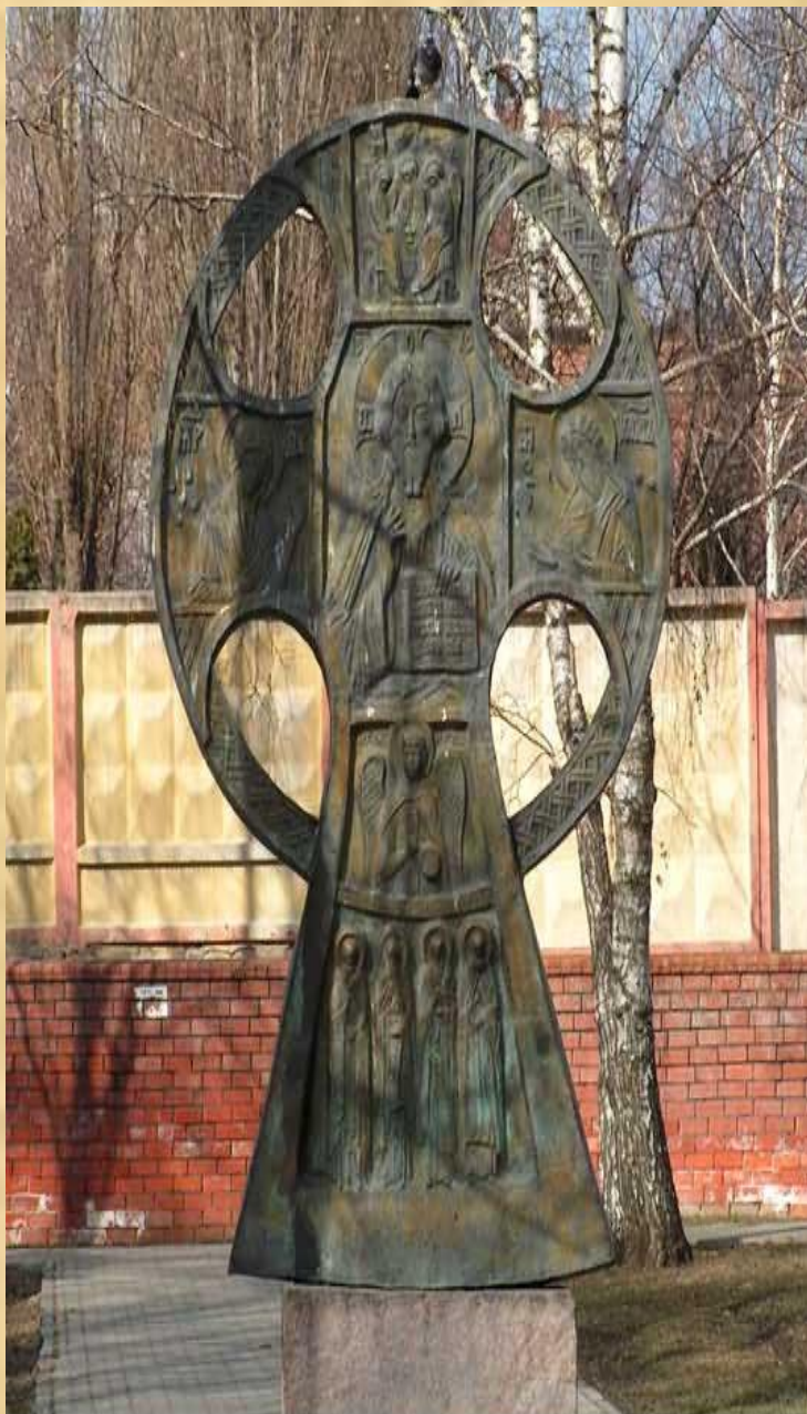
Памятник славянской письменности и культуры в г.Белгороде.

В память о великом подвиге Кирилла и Мефодия 24 мая во всем мире празднуется День славянской письменности. Особенно торжественно отмечается он в Болгарии. Там совершаются праздничные шествия со славянской азбукой и иконами святых братьев. Начиная с 1987 года, и в нашей стране в этот день стал проводиться праздник славянской письменности и культуры. Русский народ отдает дань памяти и благодарности "славянских стран учителям..."