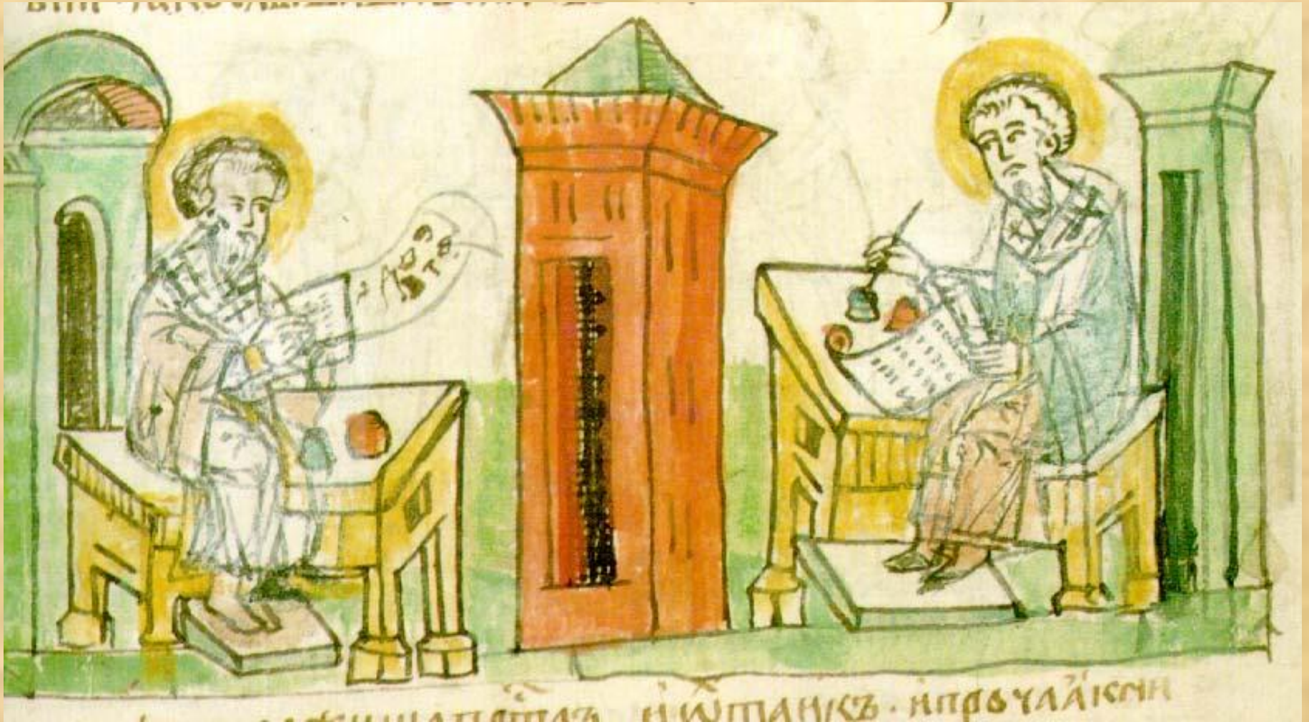
Святые Кирилл и Мефодий создают церковнославянскую азбуку. Миниатюра Радзивиловской летописи. XV в.