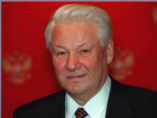
Б. Н. Ельцин первый президент России

К сожалению, ни на одном варианте не остановились.