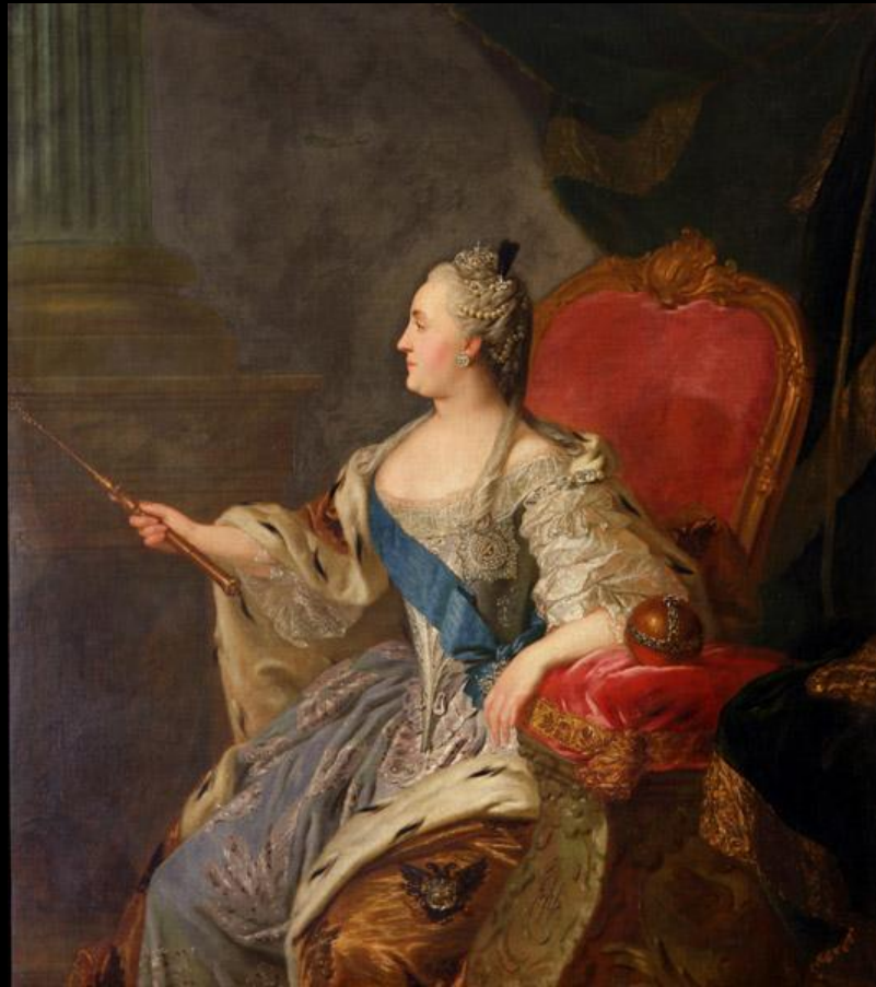
Рокотов. Портрет Екатерины II.