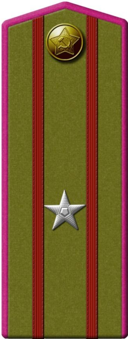
Погон_майор_1943-1945. На погоне две тонкие полоски малинового цвета (обозначение пехоты)

Вместо петлиц для различения званий были введены погоны, которые упразднили еще в 1917 году. Долгое время погоны рассматривались как знак царского офицерства, сословности армии.