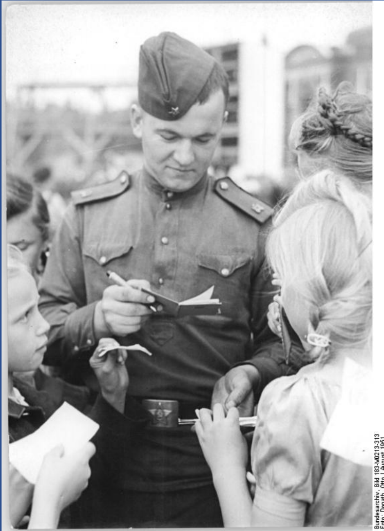
Bild 183-M0213-313 August 1951

Гимнастерка, которая по своему покрою напоминала русскую крестьянскую рубаху, была основным элементом одежды военнослужащего. Ее покрой был одинаков для солдат и офицеров. Отличия солдатской и офицерской гимнастеровок проявлялись в форме клапанов у карманов, наличии самих карманов, присутствии окантовки, нашивках и т.д.