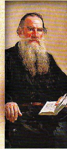
Л. Н. Толстой После бала

(Построение художественного произведения, обусловленное его содержанием и характером)