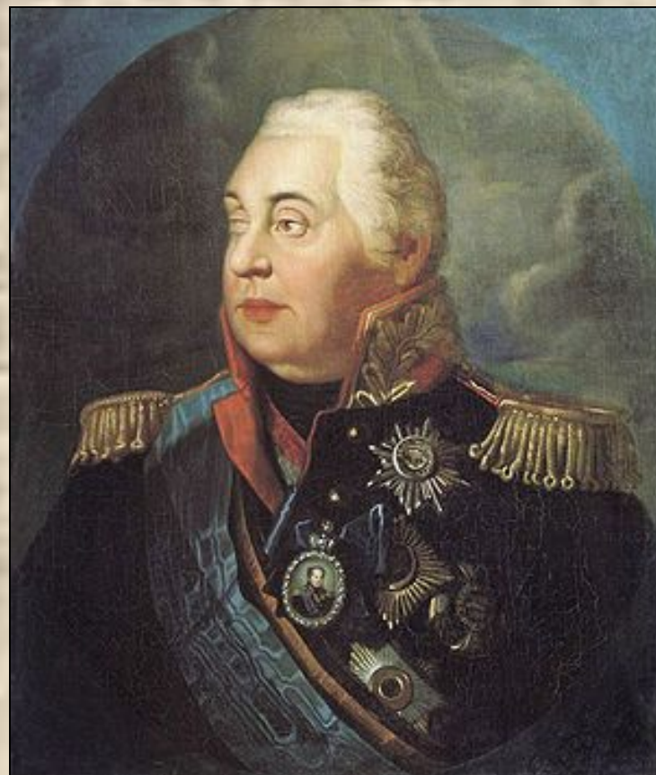
Михаил Илларионович Кутузов – русский полководец