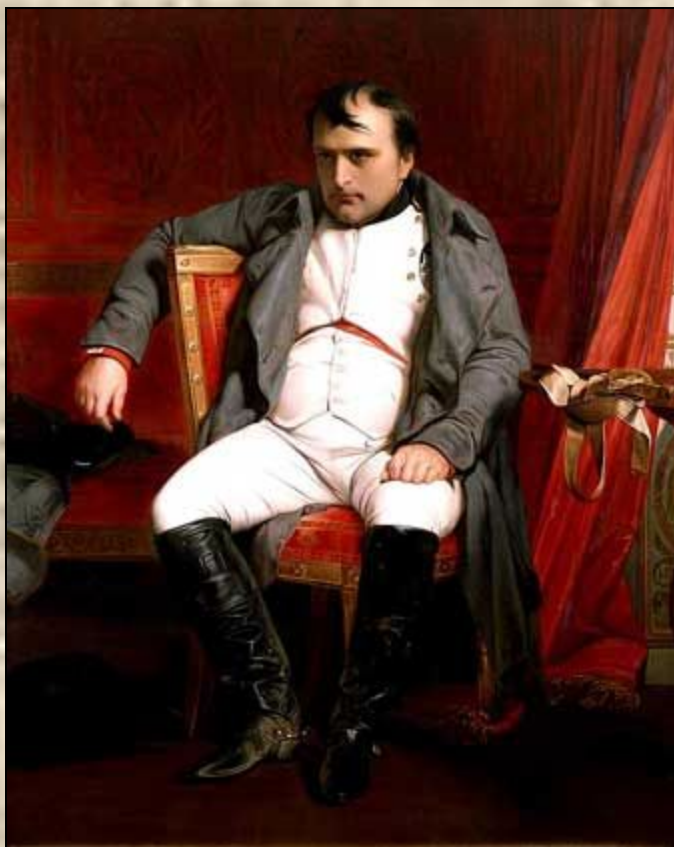
Бонапарт Наполеон – император Франции