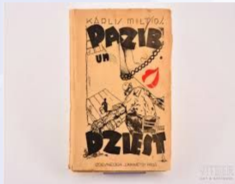
"Pazib un dziest" 1936.g.