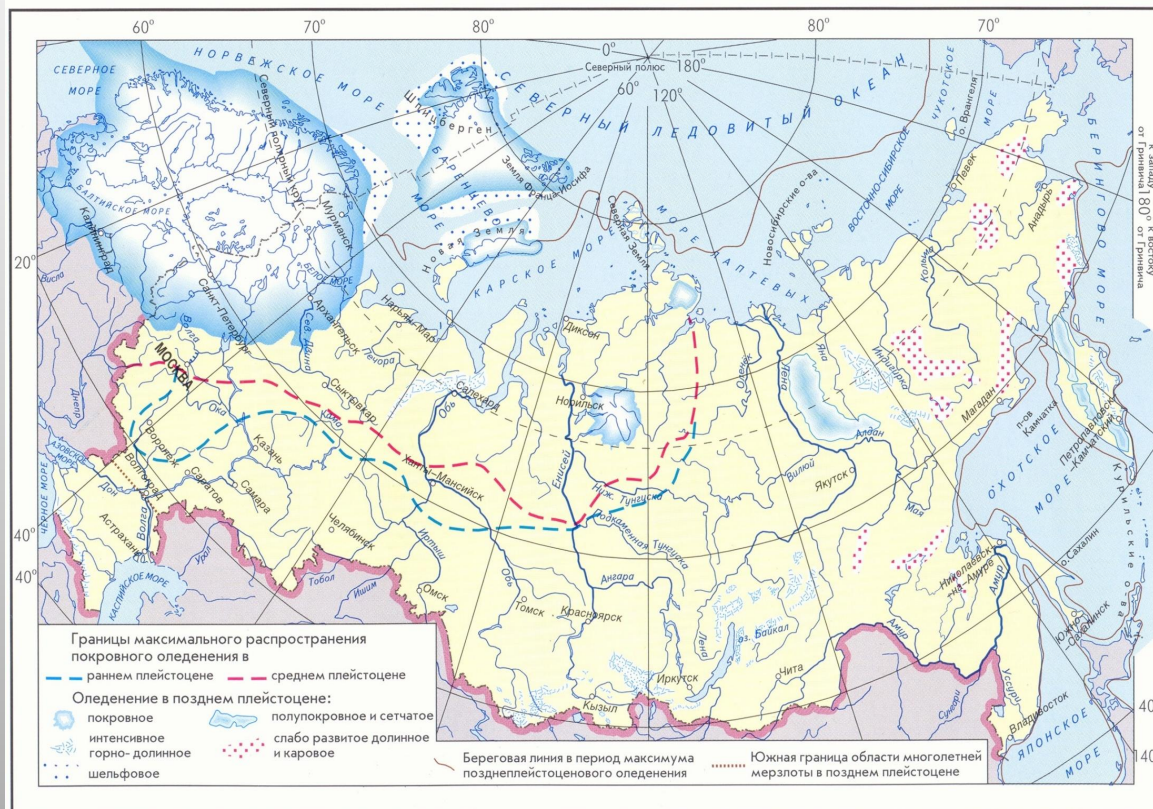
ОЛЕДЕНЕНИЯ ЧЕТВЕРТИЧНОГО ПЕРИОДА

100 тыс. лет назад – начало ледникового периода на земле