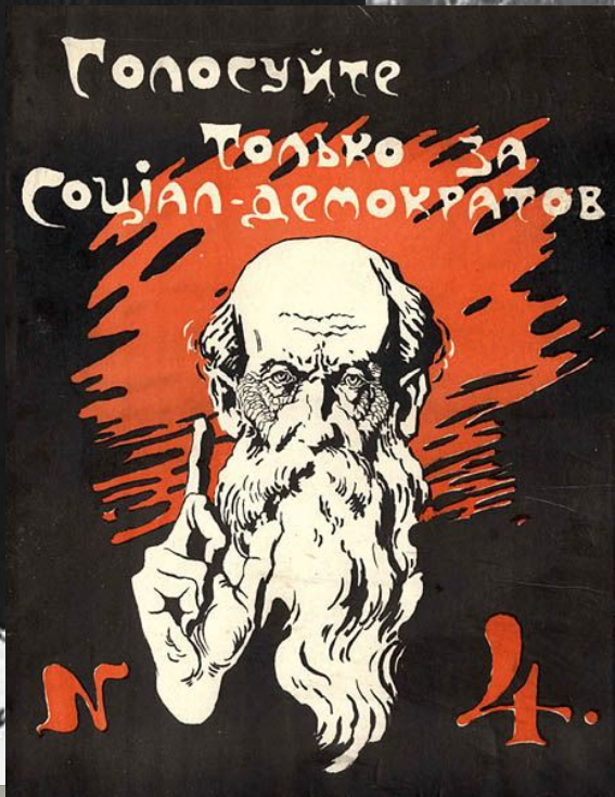
Плакаты, посвященные выборам в Учредительное собрание