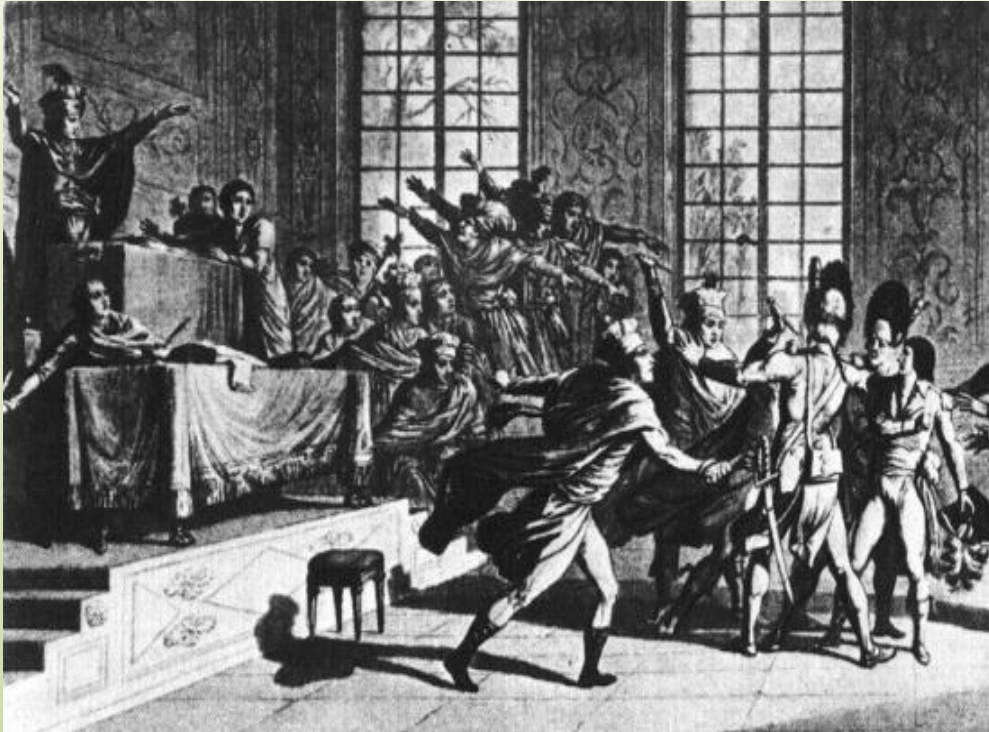
Госуд.переворот 18 брюмера (8-9 ноября) 1799 г. Гравюра к.XVIII в.