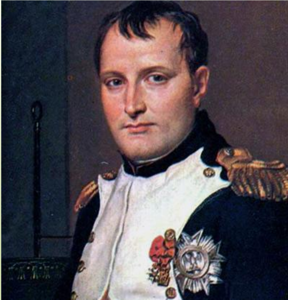
Наполеон Бонапарт (1769-1821)

Летом 1793г. Наполеон Бонапарт отличился при взятии захваченной англ. крепости Тулон . Получил чин бригадного генерала.