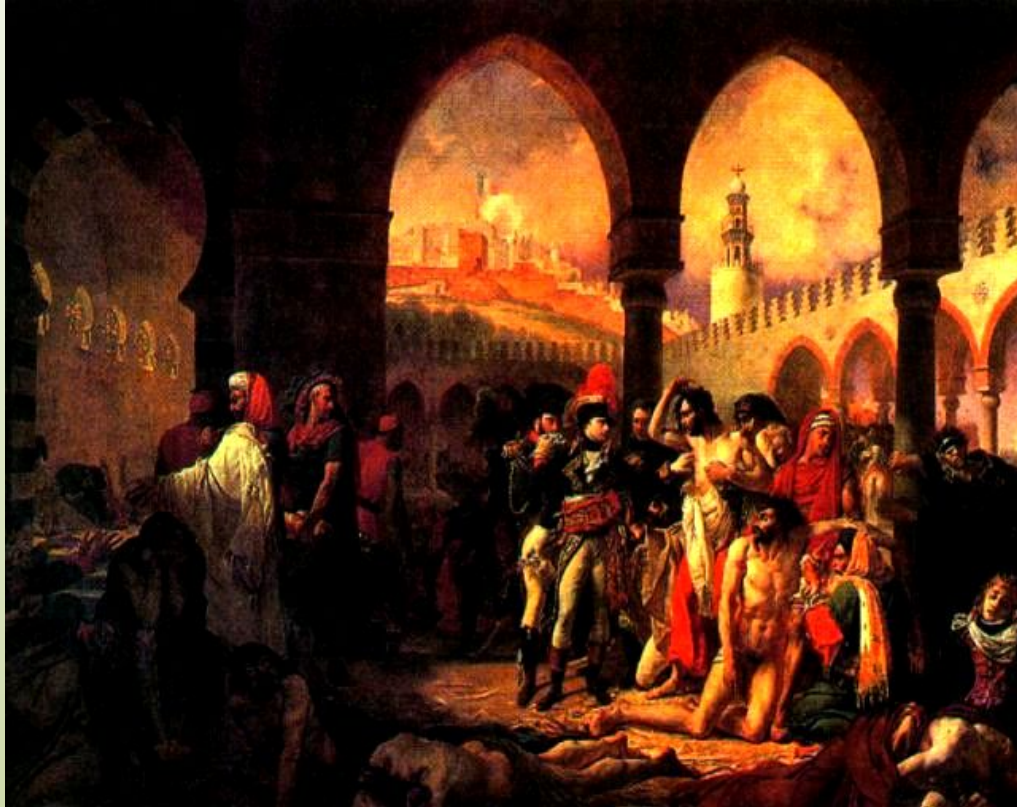
А.Ж.Гро. Бонапарт, посещающий Зачумленных в Яффе.

В 1798 г. Наполеон решил нанести удар по Великобритании, захватив ее владения в Египте .