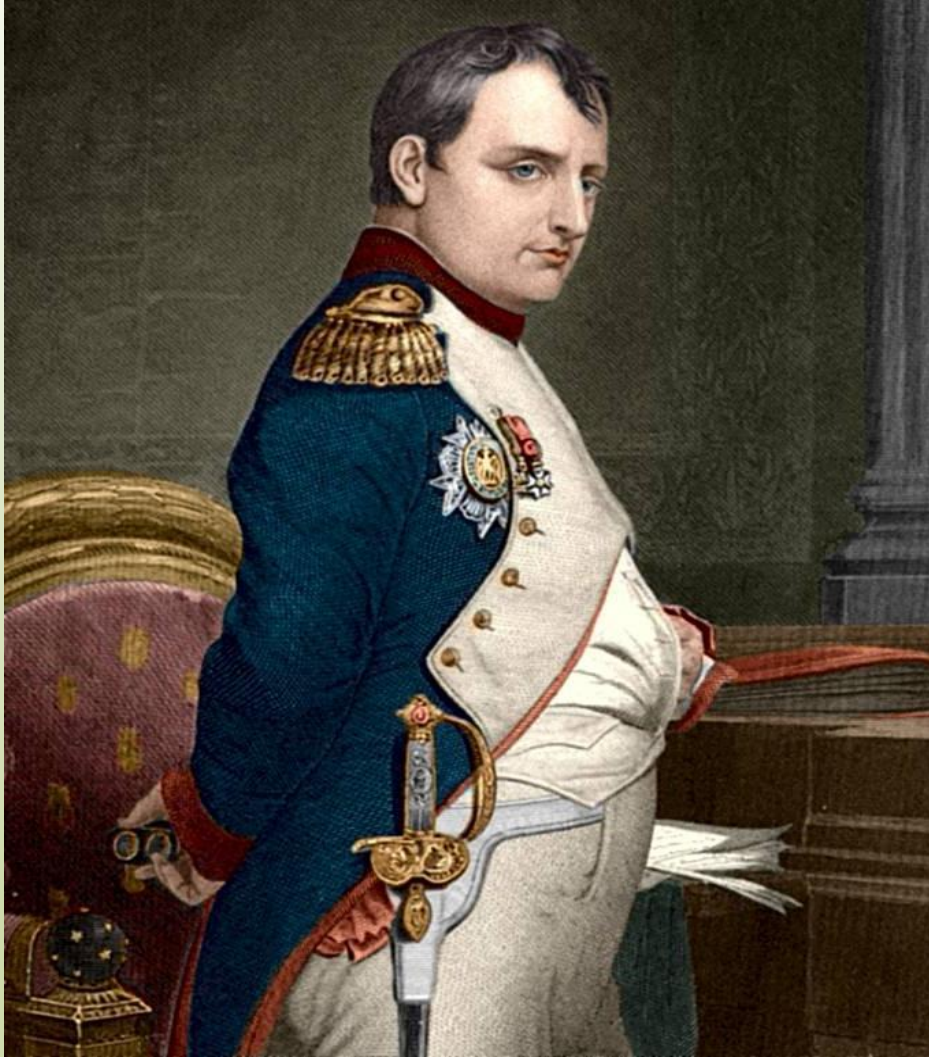
Наполеон Бонапарт (1769-1821)