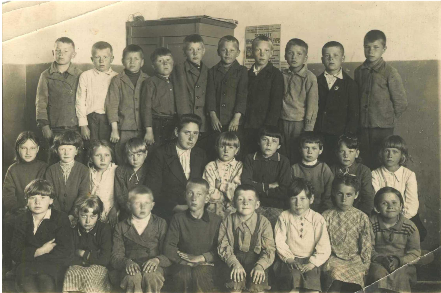
2 «б» класс 1949 год