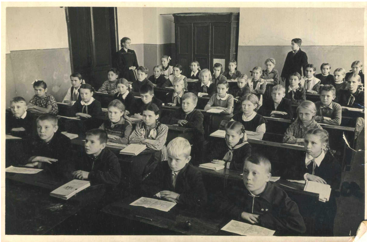
6 класс 1953 география