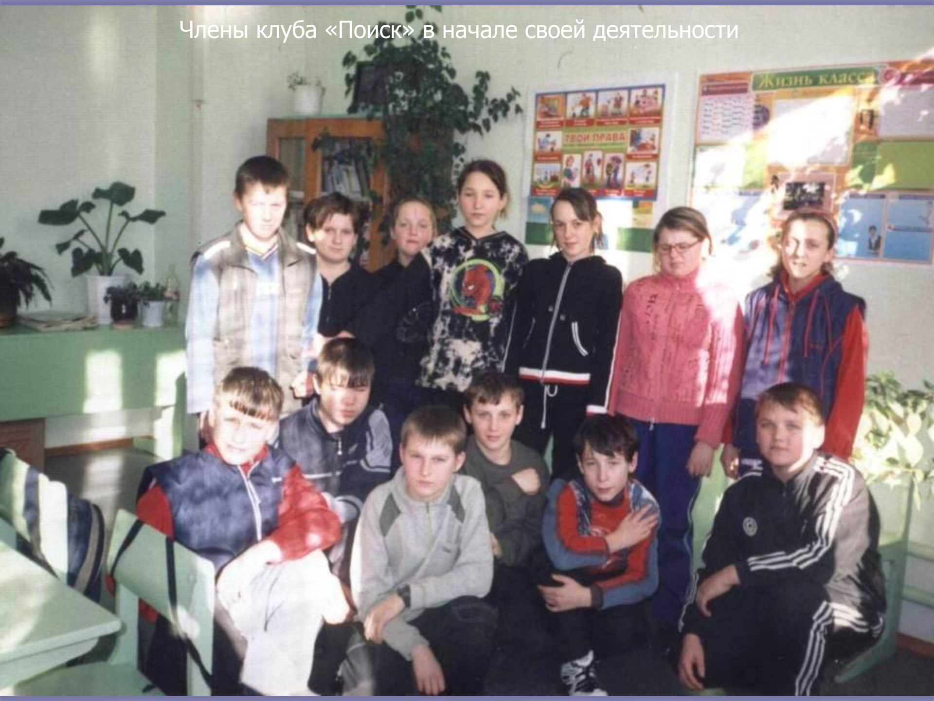
Члены клуба «Поиск» в начале своей деятельности