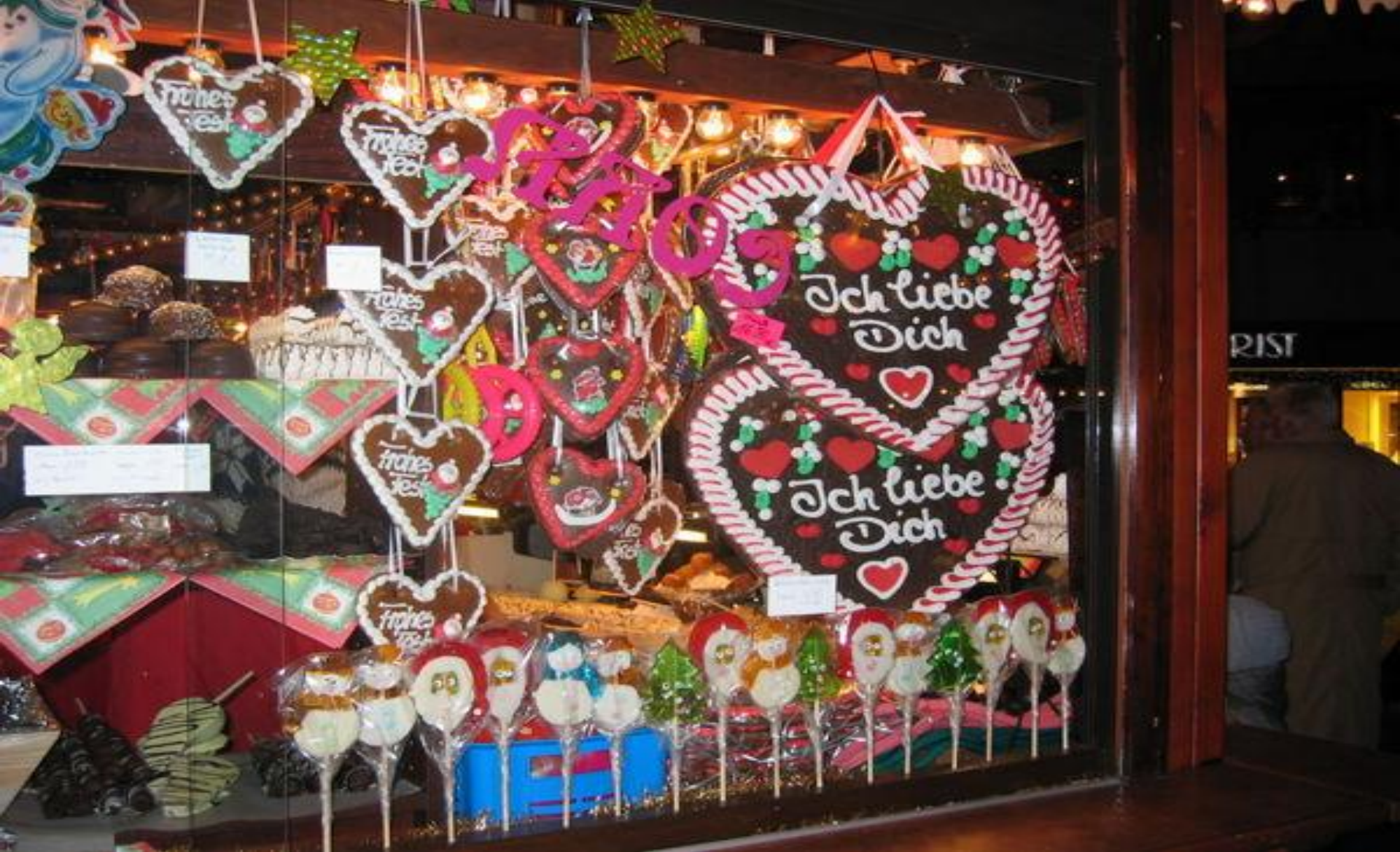
Прилавок с сувенирами.