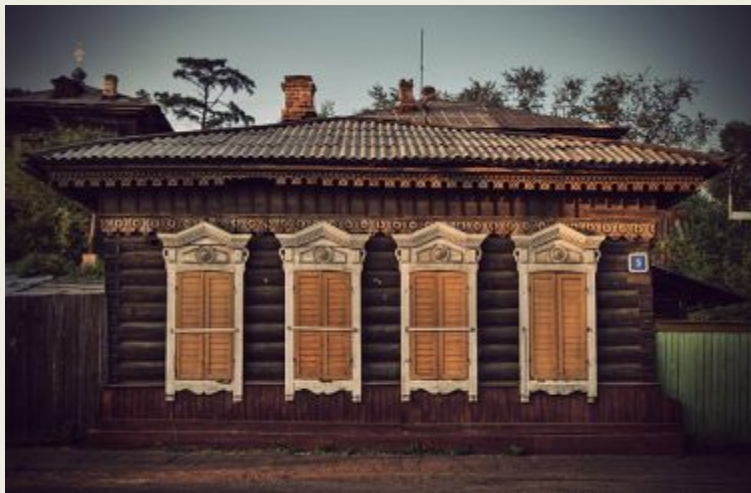
Окна дома закрыты ставнями

Что такое « ставни » – деревянный затвор, « ставни » на окнах в деревянных домах.