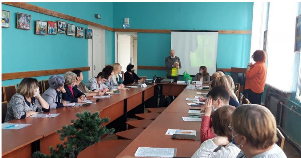
Вопросы развития межнациональных отношений обсудили в Сегеже