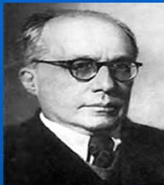
Рубинштейн Сергей Леонидович (1889-1960)