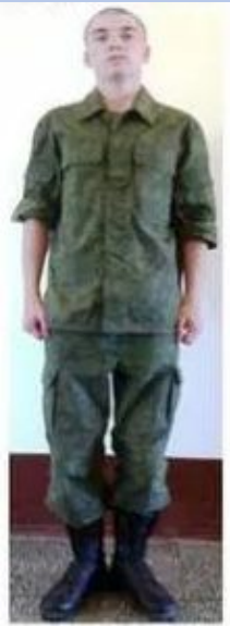
Форма №3 Форма №5

1.5.2. Форма одежды предназначена для выполнения служебных обязанностей вне помещения в холодное время года