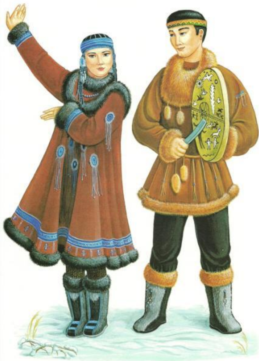
ЧУКОТСКИЙ НАРОДНЫЙ КОСТЮМ