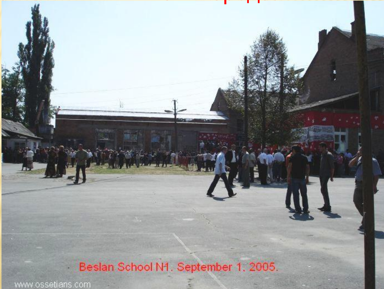
Beslan School N1. September 1, 2005.

10.50 – вокруг школы выставляется оцепление из бойцов ВВ, милиции и спецназа. К кольцу оцепления собираются родственники и жители города.