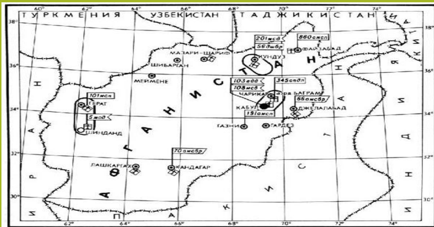
Дислокация частей и соединений 40-й Армии.

ПЕРЕВЕРНЁМ ИСТОРИИ СТРАНИЦУ. ЗАТИХНЕТ ВЬЮГА ТЕХ ГОРЯЧИХ ДНЕЙ. КТО БЫЛ В АФГАНЕ, ПУСТЬ ГОРДИТСЯ, КТО НЕ БЫЛ ТАМ, ОБ ЭТОМ НЕ ЖАЛЕЙ.