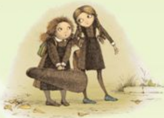
Иллюстрация Елены Жуковской

«Манюня» – книга о детстве. Смешном, прекрасном и полном всякоразных приключений. Если вы любите смеяться, эта книга для вас.