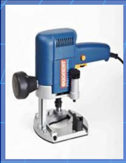
МАШИНА ФРЕЗЕРНАЯ РУЧНАЯ МФЗ-11003