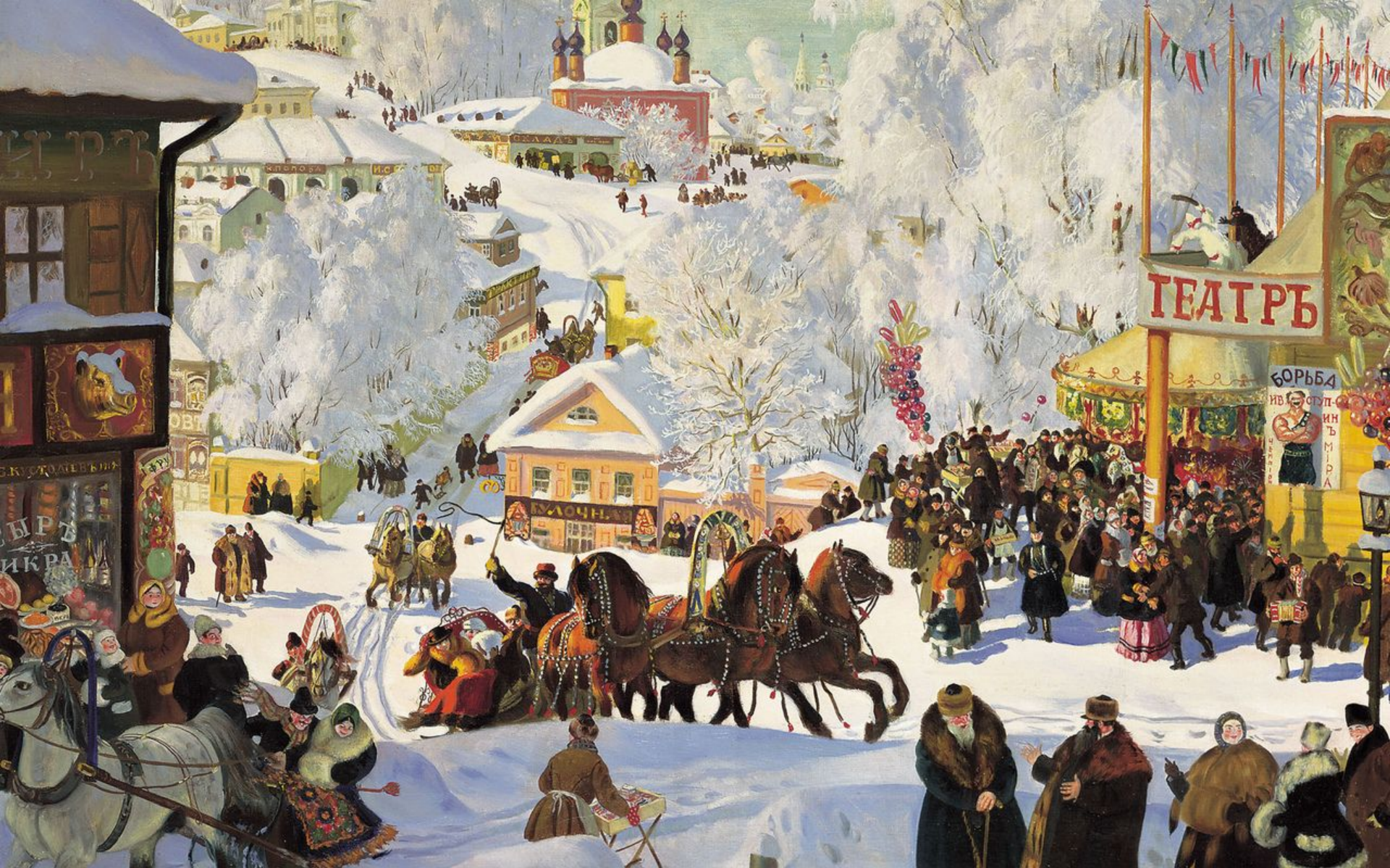
Б. Кустодиев Масленица