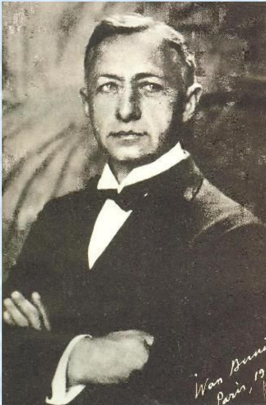
Иван Алексеевич Бунин, 1927