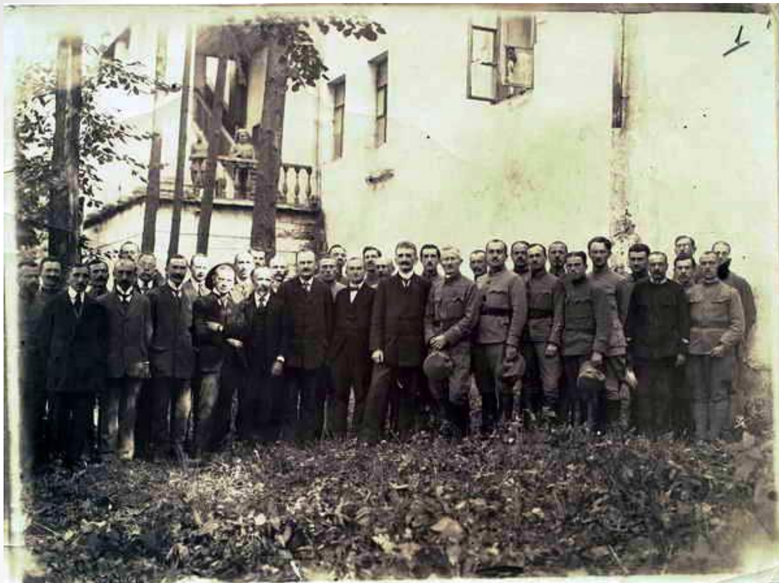
Члени Уряду Західноукраїнської Народної Республіки(ЗУНР) у м. Кам'янці-Подільському. 1919 р.