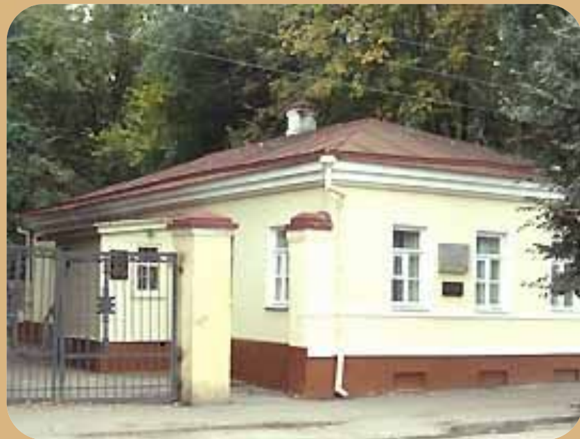
Дом И.С. Никитина

Стихи он стал писать очень рано, но долго не решался их напечатать, показать их другим. И первое напечатанное стихотворение Никитина «Русь» принесло ему известность, скоро он выпустил целый сборник своих стихотворений, на вырученные средства в 1859г. он открыл в Воронеже книжный магазин и при нём дешёвую библиотеку, ставшие центром литературной и общественной жизни города.