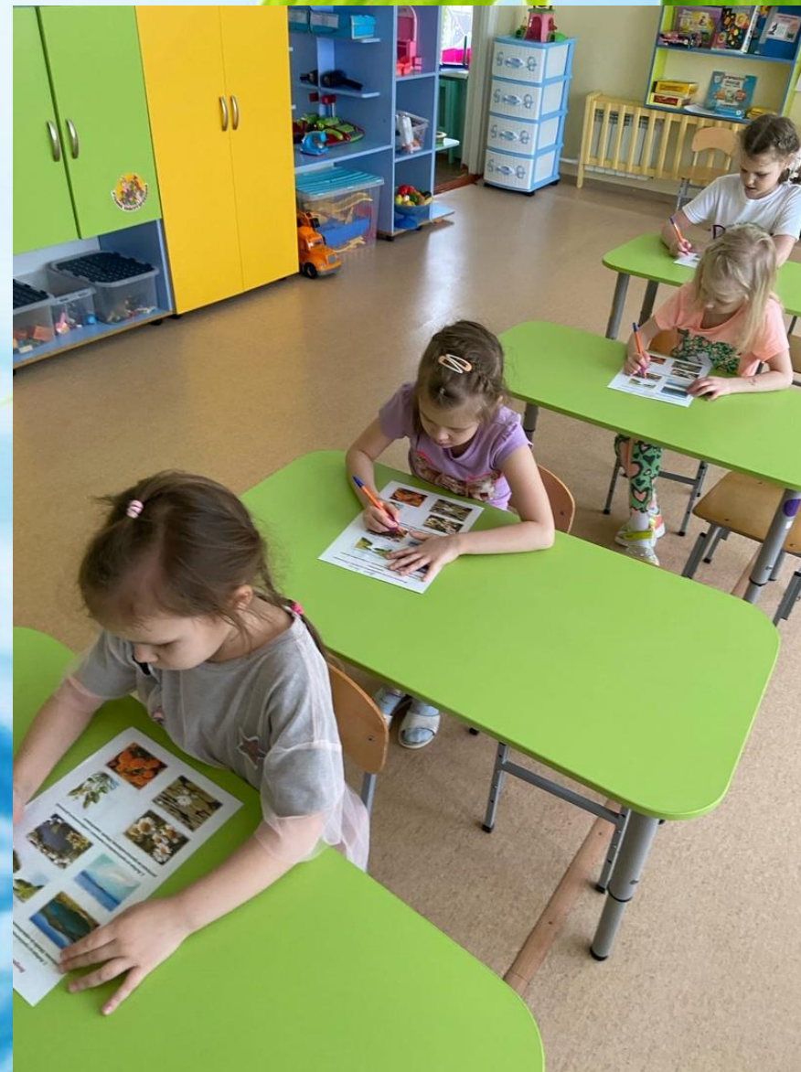
Раскраски «Растения пресных водоёмов»