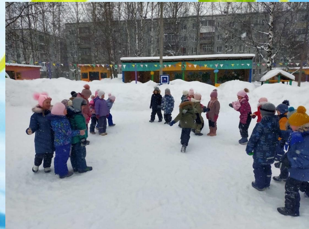
Игра «Караси и щука»